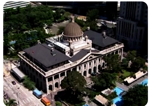
1985年至2011年的立法局/立法会大楼。