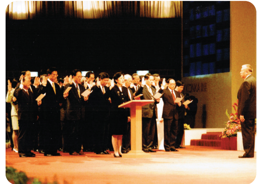
临立会议员于1997年7月1日宣誓就职。

《立法会条例草案》获通过 临立会通过《立法会条例草案》，以确保香港特区第一届立法会能成立。