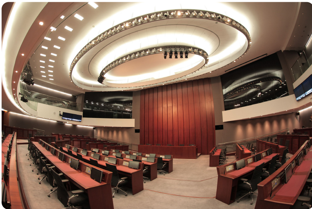
财务委员会及内务委员会的会议通常于会议室1举行。

议员个人利益监察委员会 —— 议员个人利益监察委员会研究《议员个人利益登记册》的编制、备存及取览等各项安排，并考虑及调查与议员个人利益的登记及申报有关的投诉，以及与议员申请发还工作开支或申请预支营运资金的行为有关的投诉。委员会亦考虑关乎议员以其议员身份所作行为的操守标准事宜，以及就该等事宜提供意见及发出指引等。