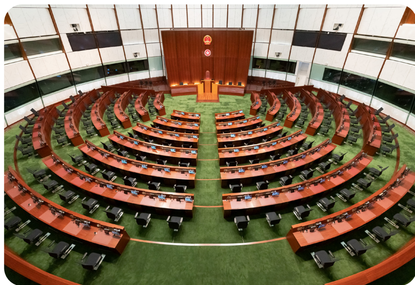
立法会会议在立法会会议厅举行