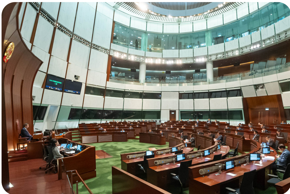
议员于立法会会议席上就拨款法案发言

财政司司长在财政预算案演辞中提出的收入建议，会分别以条例草案或附属法例的形式提交，供立法会审议。为保障公共收入，行政长官有权作出公共收入保障命令，使须在宣读预算案当日或有关的赋权法例制定前生效的收入建议（例如增加烟草税的收入建议），可即时生效。如有需要，立法会可成立法案委员会及小组委员会审议有关收入的建议。