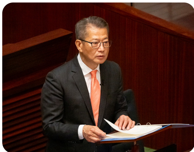
财政司司长陈茂波先生在立法会会议上发表财政预算案演辞

各局局长会带同其政策范畴内的管制人员出席财委会特别会议，扼要说明其政策范畴内的最新发展及变化、来年的主要工作和在开支预算提出的资源需求。在特别会议举行前，财委会委员会就直接与开支预算有关的事项以书面提出问题，及在特别会议上跟进当局就书面问题给予的答覆。在特别会议后，财委会主席会向立法会提交报告。