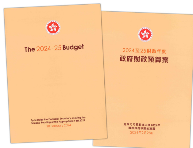
2024至25财政年度政府财政预算案