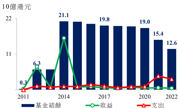
圖1 — 關愛基金年度結餘 (1)