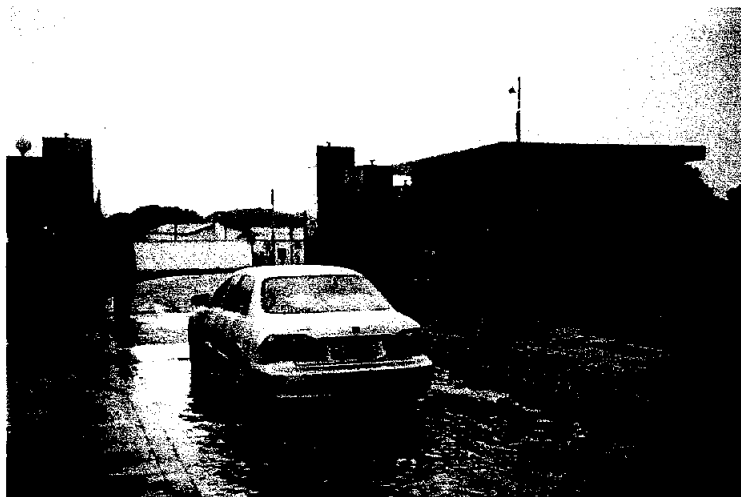
飼養場進口的汽車消毒池