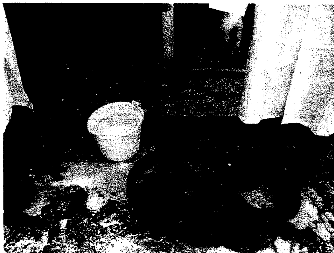
進入飼養場前的消毒步驟