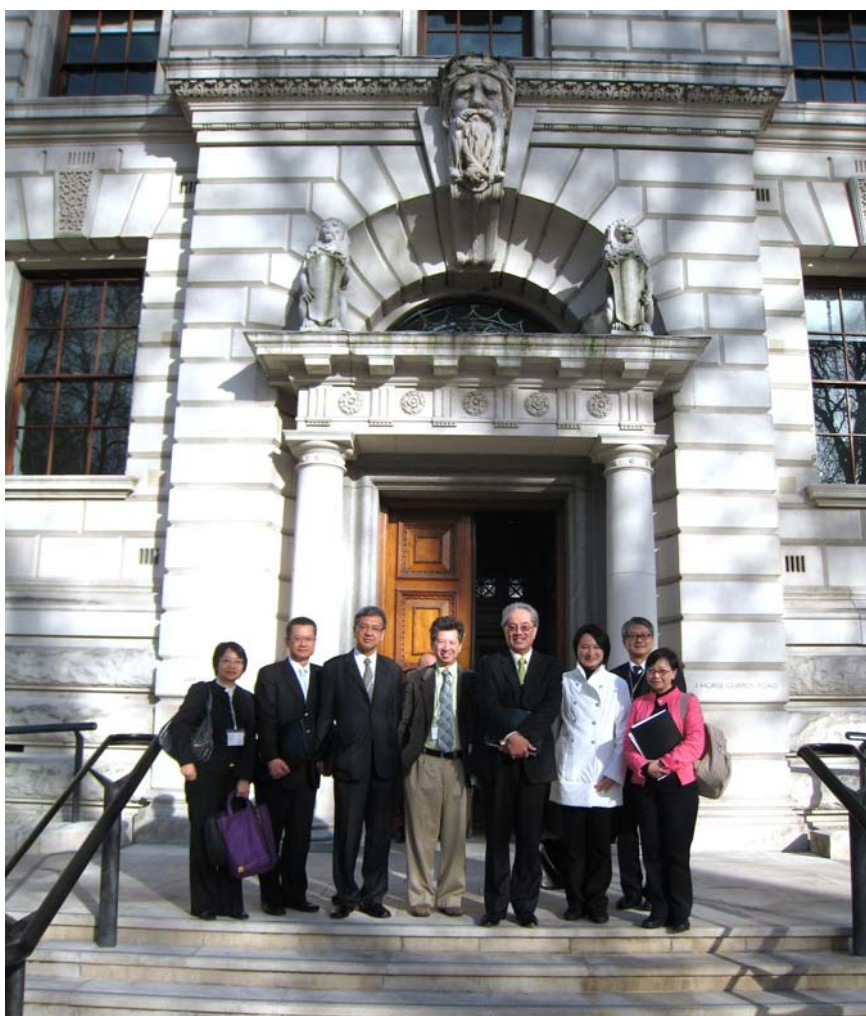
代表團在財政部合照

5.1 代表團與財政部常務次官麥格遜爵士(Sir Nicholas Macpherson)及財政部與內閣辦公室的其他相關官員會晤並聽取簡介，內容包括英國在擬備政府帳目方面的近期發展，以及內閣辦公室為達致節省開支的目的而致力提高政府部門效率及對公營機構進行改革的工作。