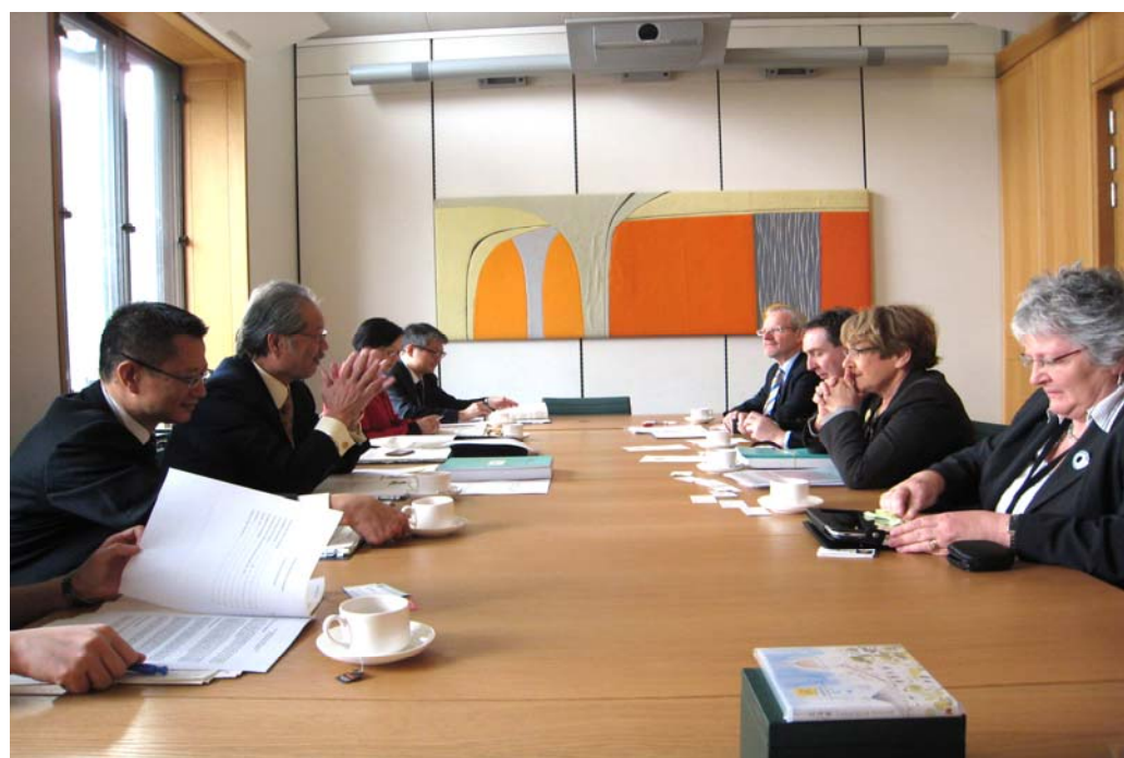
代表團就下議院帳委會對衡工量值式審計報告進行研究的方式和程序與下議院帳委會主席和委員交換意見