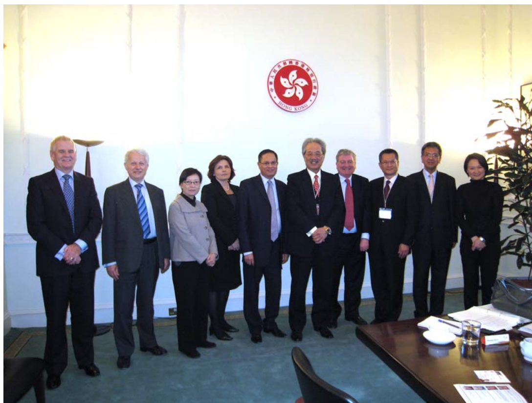
代表團與審計委員會代表合照