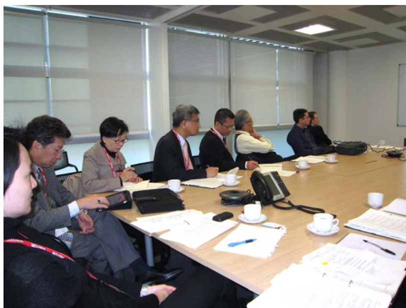
社區及地方政府署官員 向代表團簡介英國改革地方審計制度的建議