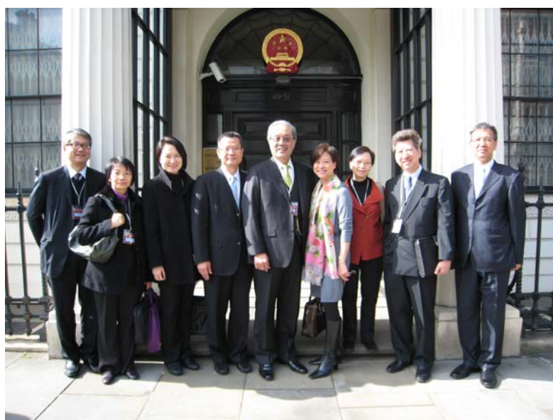
代表團在中國駐英國大使館合照