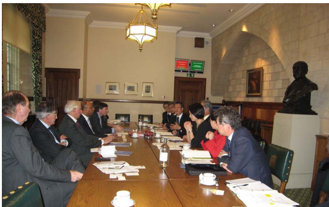
代表團與英國國會跨政黨國會中國事務小組會晤