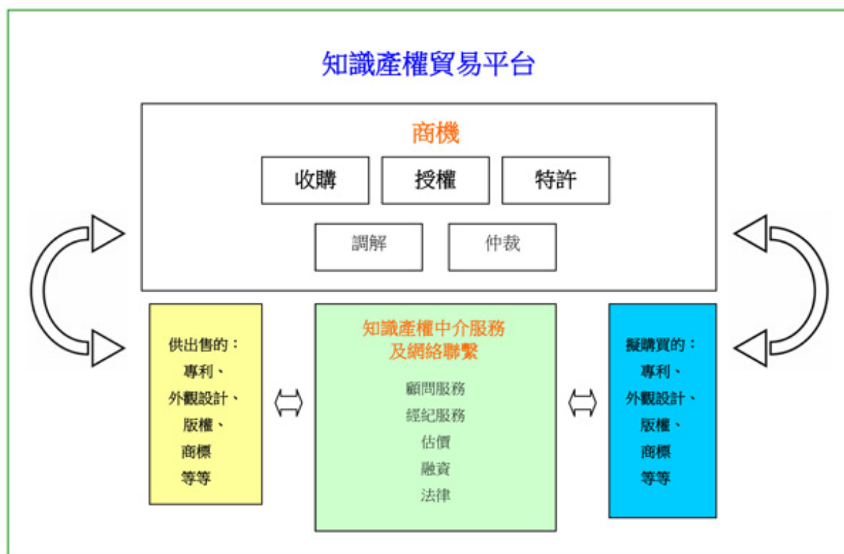
圖 1 知識產權貿易模式