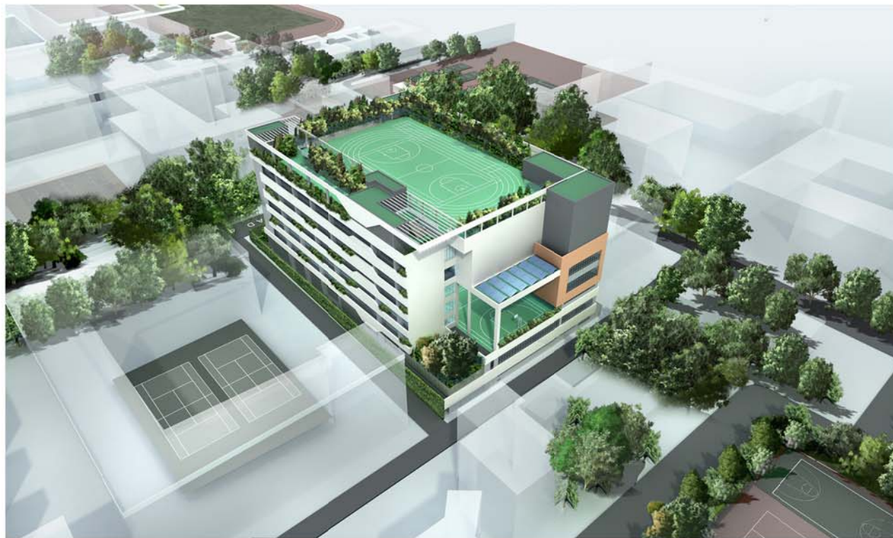
AERIAL VIEW OF THE NEW SCHOOL PREMISES FROM NORTHWEST 從西北面望向校舍鳥瞰構思圖

92EB - REDEVELOPMENT OF TUNG WAH GROUP OF HOSPITALS WONG FUT NAM COLLEGE AT OXFORD ROAD, KOWLOON