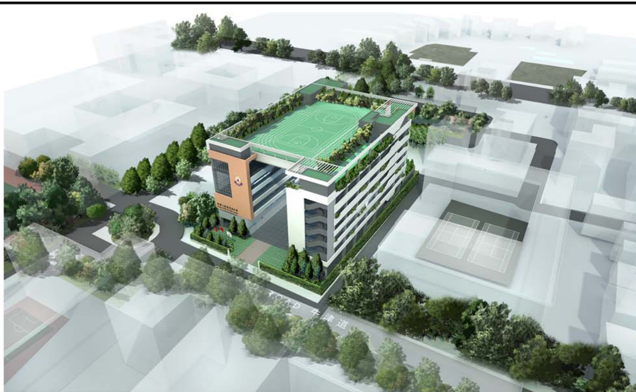
AERIAL VIEW OF THE NEW SCHOOL PREMISES FROM NORTHEAST 從東北面望向校舍鳥瞰構思圖