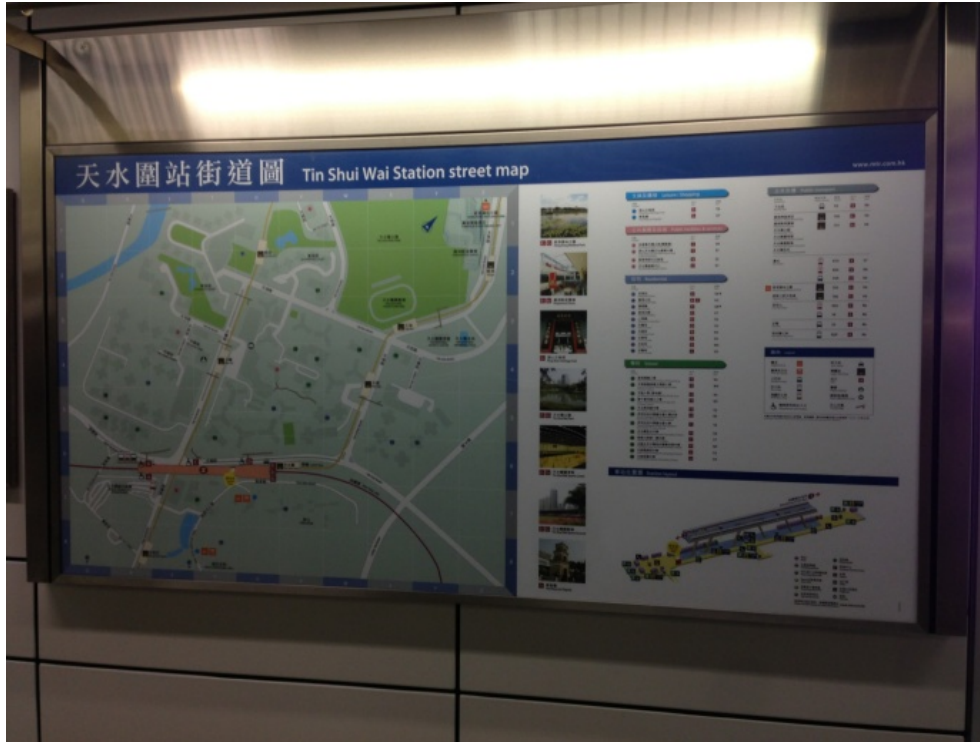
西鐵天水圍站站內地圖