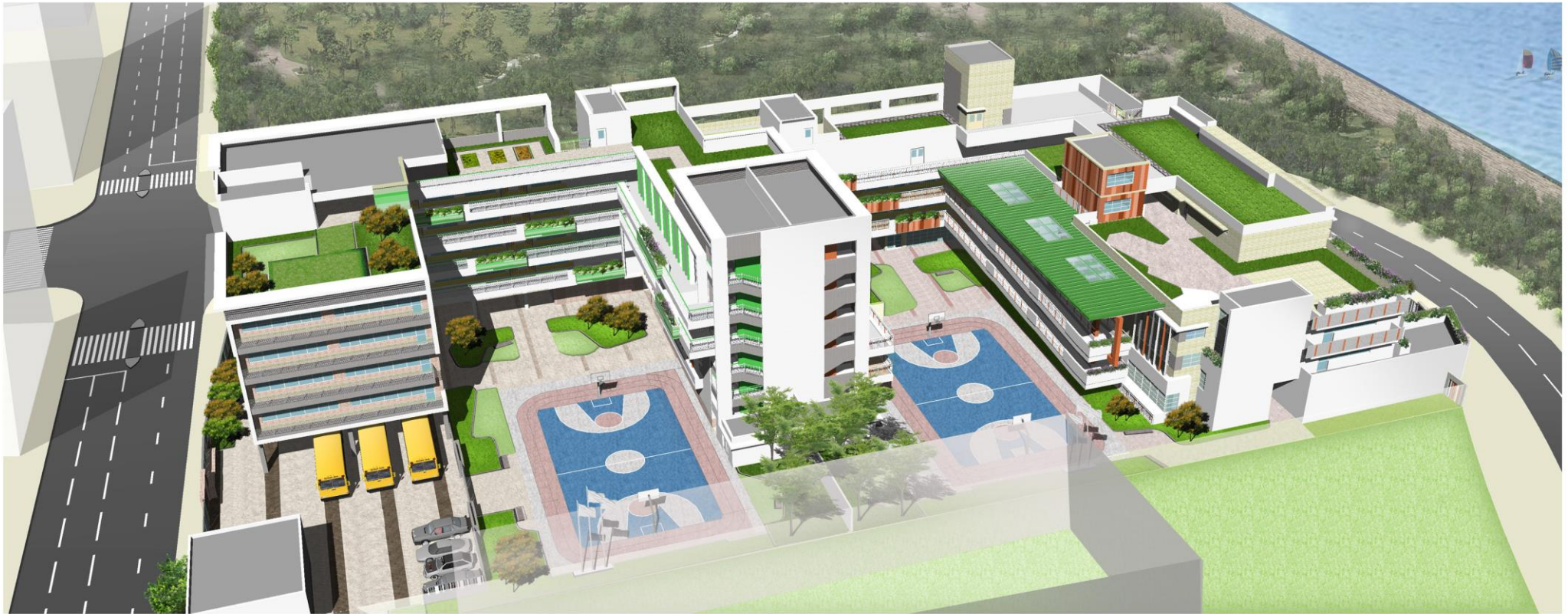
中度智障兒童學校 MoID SCHOOL