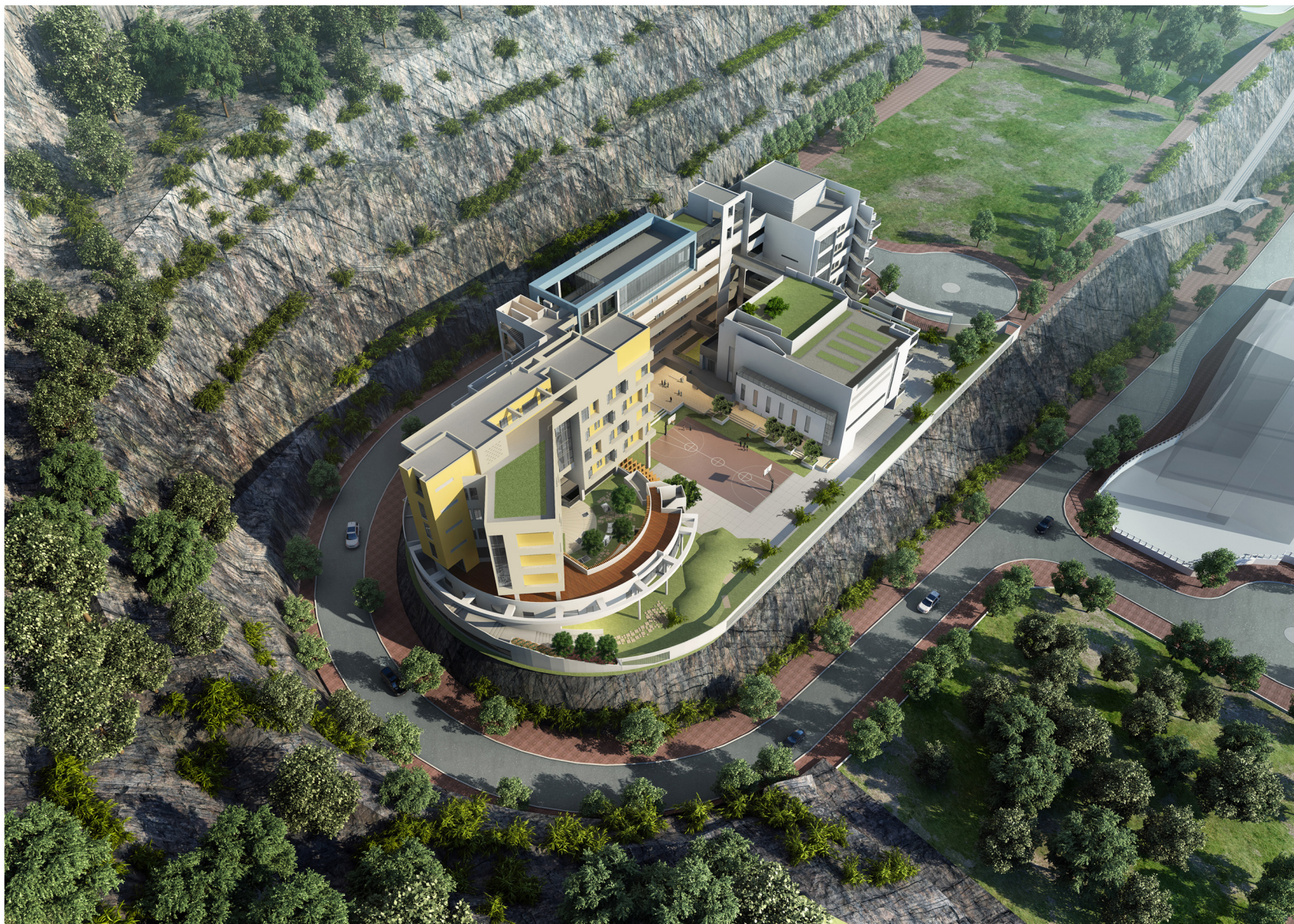
從東北面望向學校的鳥瞰圖 AERIAL VIEW FROM NORTH EASTERN DIRECTION (ARTIST'S IMPRESSION)