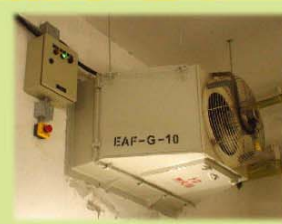
排煙系統 Smoke Extraction System