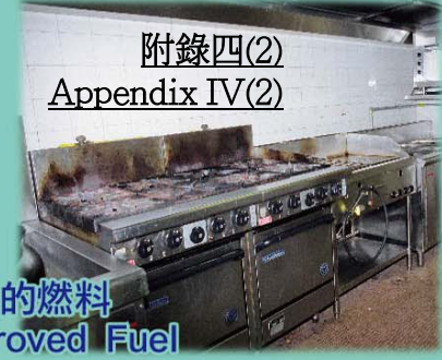
附錄四(2) Appendix IV(2)