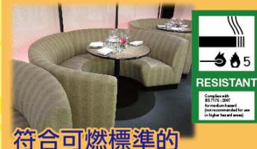
符合可燃標準的 聚氨酯乳膠 PU Foam conformed to Flammability Standard