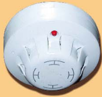
火警偵測系統 Fire Detection System

持牌人須時刻遵從 消防安全規定。 The licensee must continue to comply with FSRs.