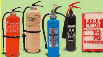
手提滅火裝備 Portable Firefighting Equipment

食物環境衛生署會在收到消防處的通知後就違反 消防安全規定的持牌條件發出警告信。 FEHD will issue warning letter for breach of licensing condition due to non-compliance of FSRs upon notification by FSD. 違反多於一項主要消防安全規定可引致食物業牌照 被暫時吊銷。 Non-compliance of more than one Major FSRs is liable to suspension of food business licence.