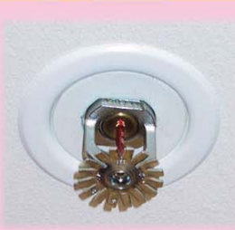
花灑系統 Sprinkler System