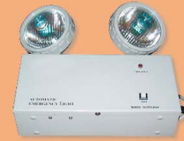
應急照明系統 Emergency Lighting