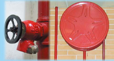
消防栓 / 喉轆系統 Hydrant / Hose Reel System