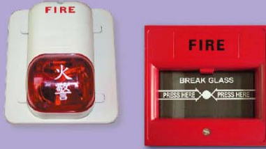
手動火警警報系統 Manual Fire Alarm System