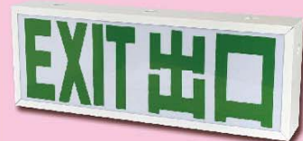
出口指示牌 Exit Sign