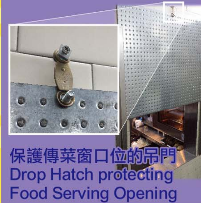
保護傳菜窗口位的吊門 Drop Hatch protecting Food Serving Opening

食物環境衛生署會在收到消防處的通知後就違反 消防安全規定的持牌條件發出警告信。 FEHD will issue warning letter for breach of licensing condition due to non-compliance of FSRs upon notification by FSD. 違反多於一項主要消防安全規定可引致食物業牌照 被暫時吊銷。 Non-compliance of more than one Major FSRs is liable to suspension of food business licence.