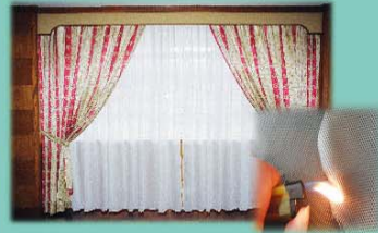
防火漆 / 溶液處理 Fire Retardant Paint / Solution Treatment