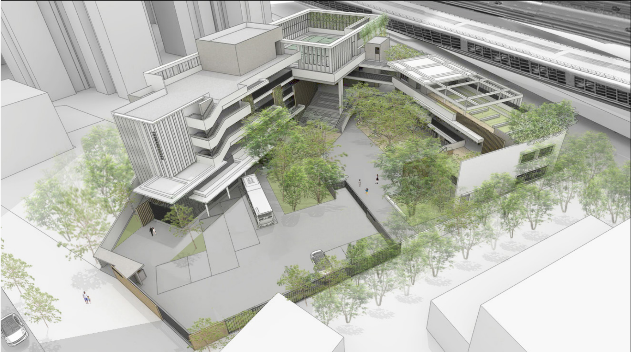
從東北面望向學校的構思鳥瞰圖 AERIAL VIEW FROM NORTH EASTERN DIRECTION (ARTIST'S IMPRESSION)