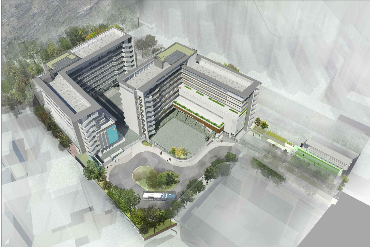
AERIAL VIEW FROM NORTHERN DIRECTION 從北面望向學校的鳥瞰圖