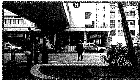
經常有街坊直接橫過馬路。