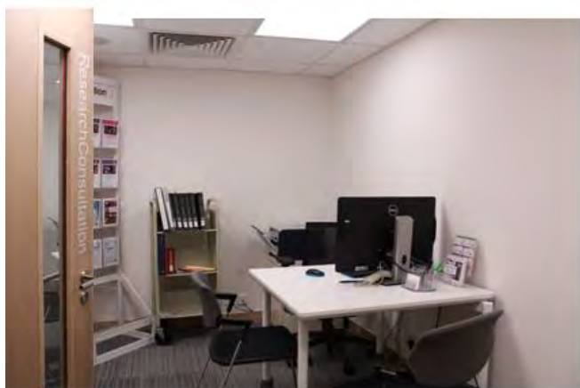
學術研究諮詢服務室 (可供使用者就研究工作進行個別諮詢)