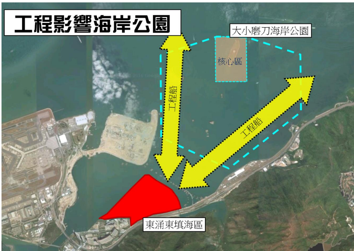
附圖二) 工程對海岸公園的影響