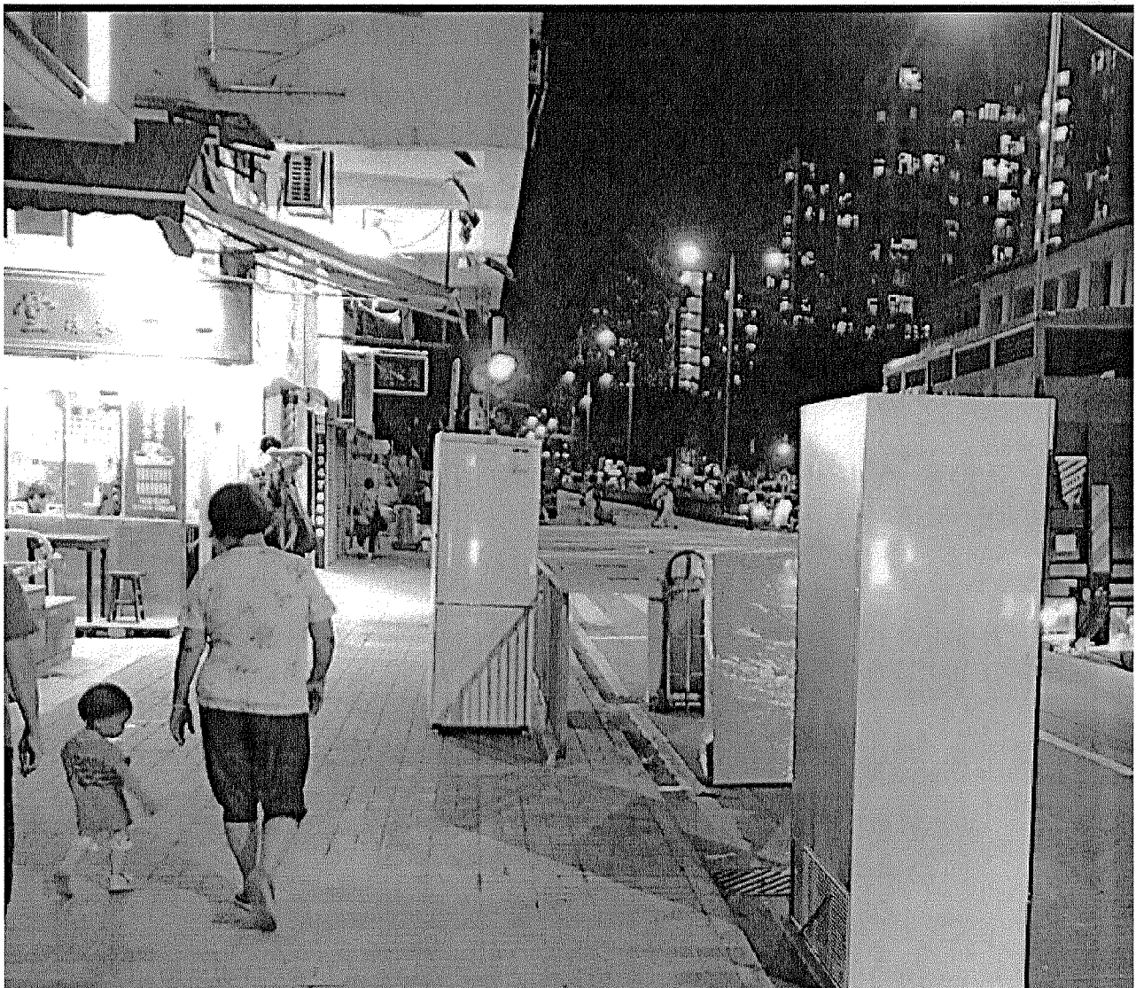
廢電器於各區收集後隨街擺放，因常態而合理化？

請職員向深水埔居民宣傳環保署即將徵收廢電器再造費，而這些收費並不會改善目前深水埔廢電器處置過程及滋擾，及解釋環保署不會監管之原因。