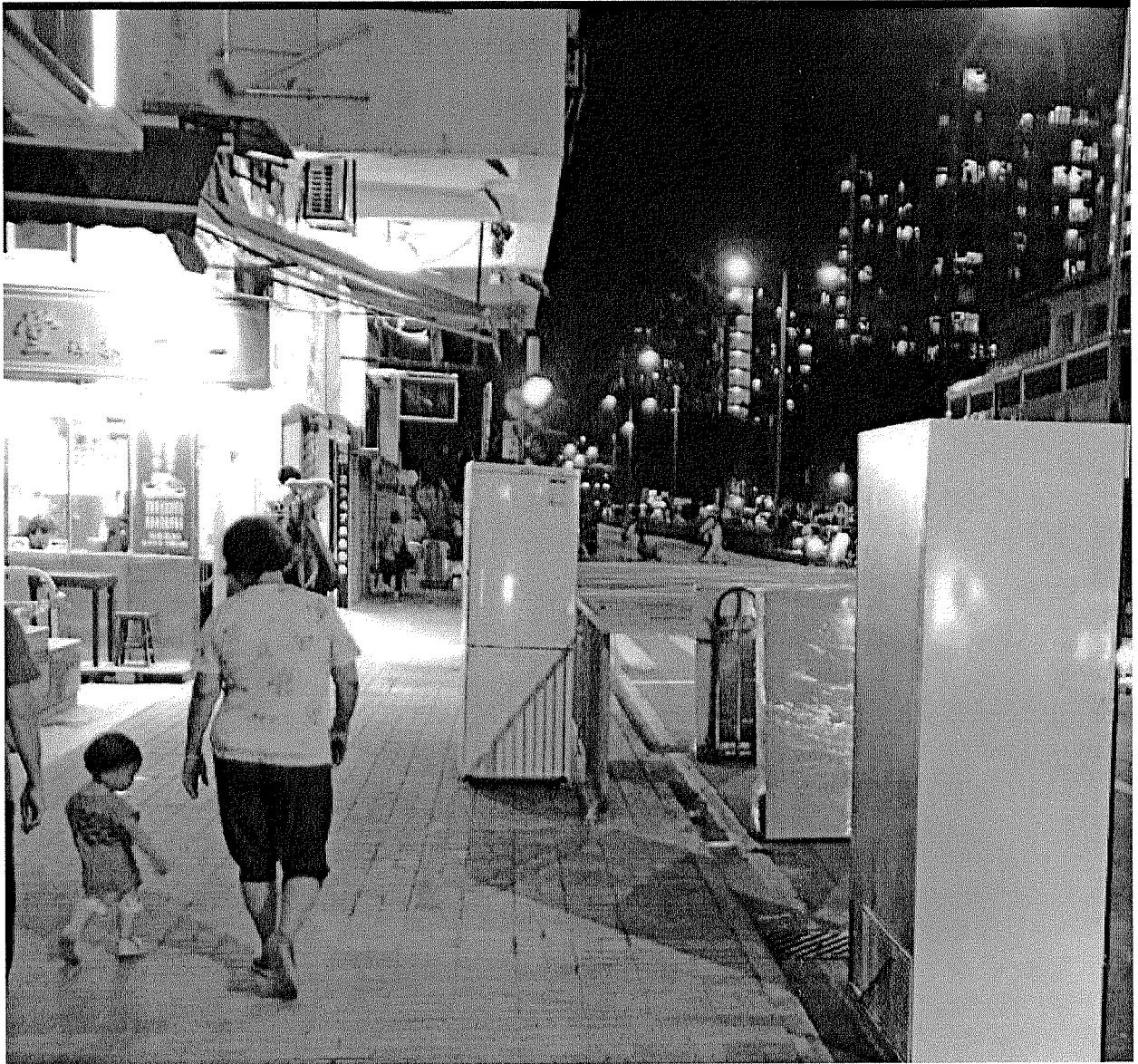
廢電器於各區收集後隨街擺放，因常態而合理化？