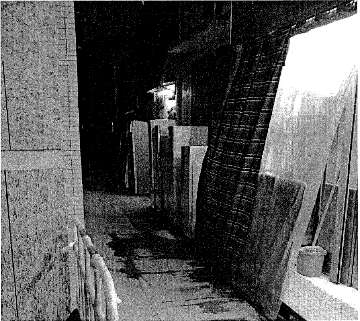
後巷是貯存廢電器之合理地方？