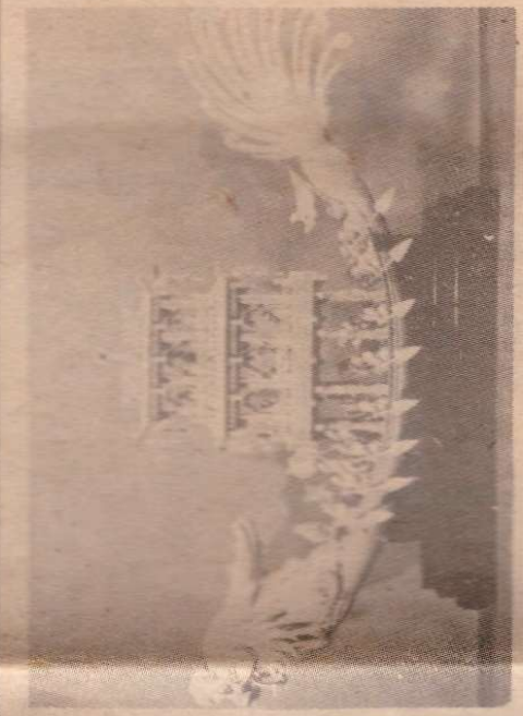
圖：這一款牙雕之中，包括了動物、公仔與亭臺樓閣，通常要集幾個師傅之功才可完成。

多經驗豐富的牙雕技師紛紛避地南來，使本港牙雕業能匯南北各派之長；近幾年來由於國際市場的競爭日益激烈，以出口為主的牙雕業，如果不在款式與雕刻上不斷推陳出新，就會遭到淘汰的命運。