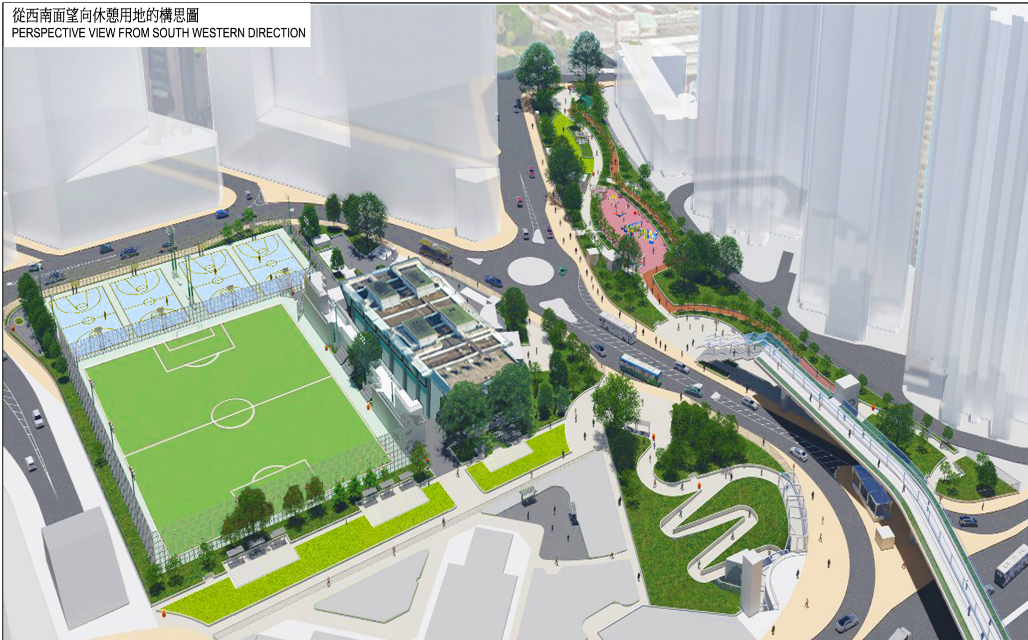
從西南面望向休憩用地的構思圖 PERSPECTIVE VIEW FROM SOUTH WESTERN DIRECTION

工務計劃項目編號 B446RO 毗鄰新蒲崗公營房屋發展項目的地區休憩用地 PWP ITEM NO. B446RO