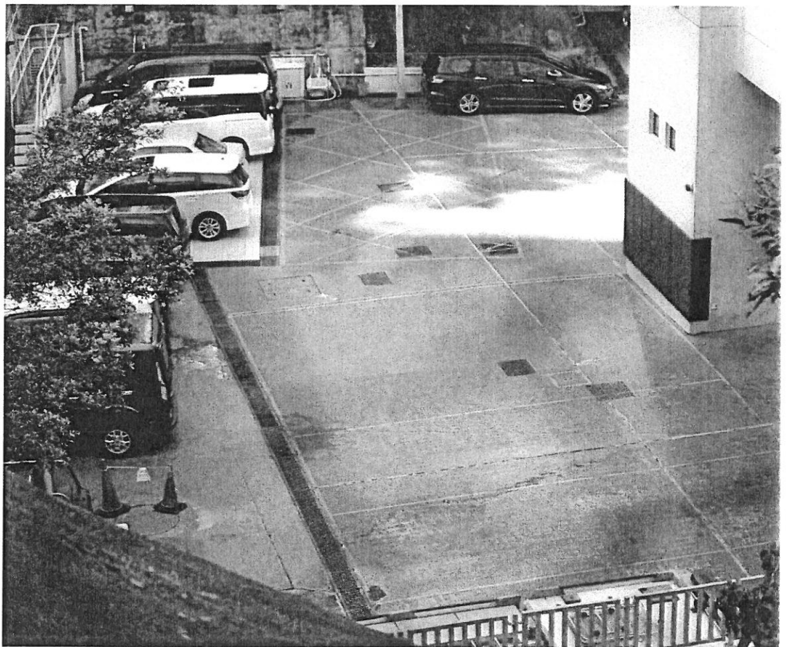
一名消防隊員在打排球時暈倒，送院後不治。

翻查資料，紀律部隊過去曾發生訓練前間猝死的事件，1998年2月，曾偵破機動部隊警司的王永基，在粉嶺機動部隊學校接受訓練跑圈時暈倒，他送院是心臟病致死。