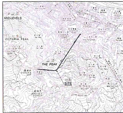
比例 SCALE 1:20 000