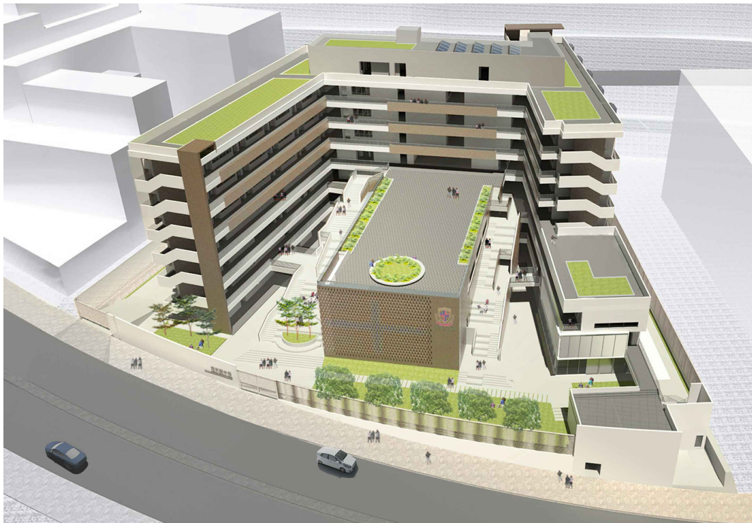
從西南面望向中學的構思透視圖