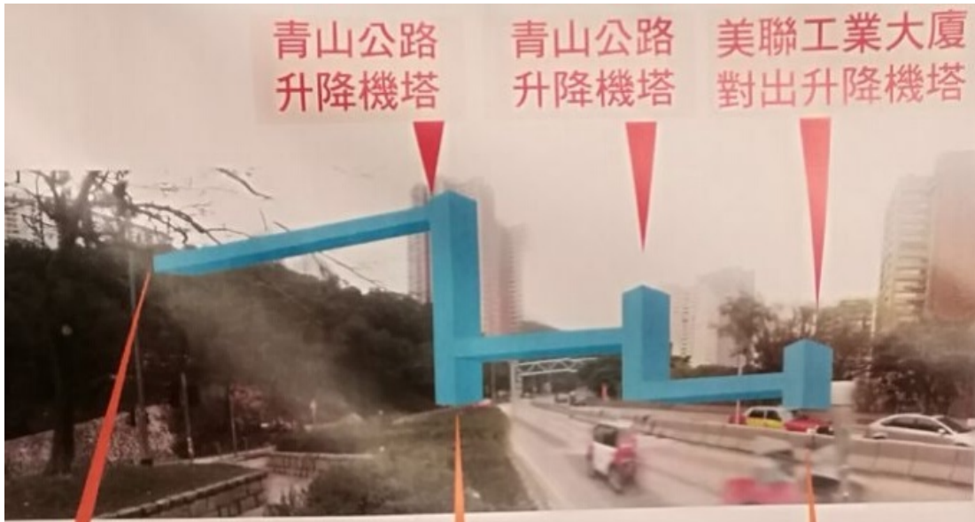
石籬邨經驗

由政府收回斜坡及美聯工業大廈，興建升降機及行人天橋。相比新田圍的升降機，石籬邨明顯更為複雜。證明政府如果有足夠的意志，其實可以成事的。