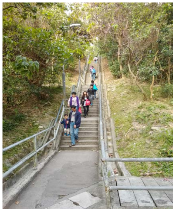
放學時間行人情況