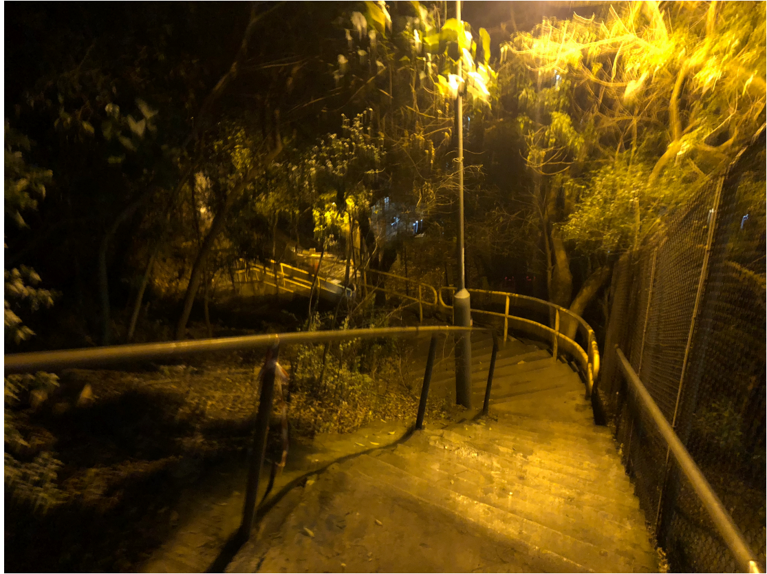
連接漁光道與舊大街的樓梯