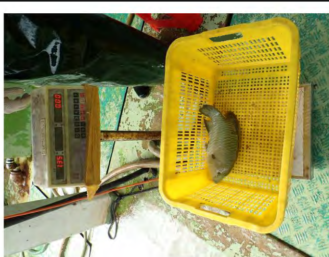
1. The length was 39 cm, 1.35 kg