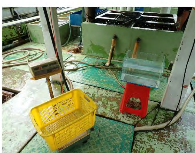
Taking measurements of 40 heads of Cheilinus undulates :