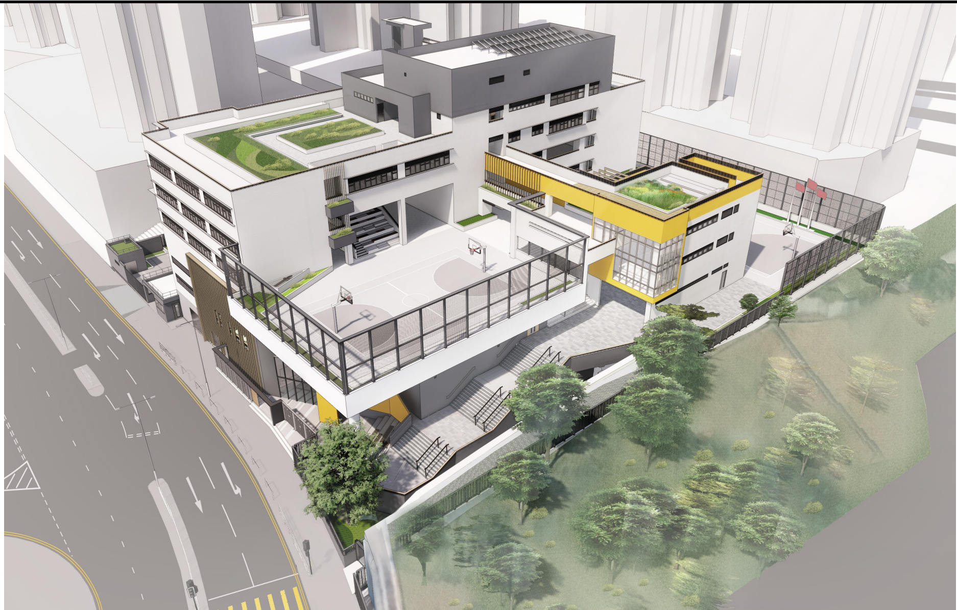
從南面望向小學的構思圖 PERSPECTIVE VIEW FROM SOUTHERN DIRECTION (ARTIST'S IMPRESSION)