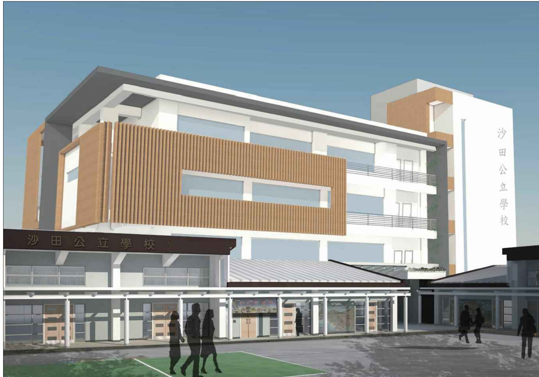
從西南面望向大樓的構思透視圖