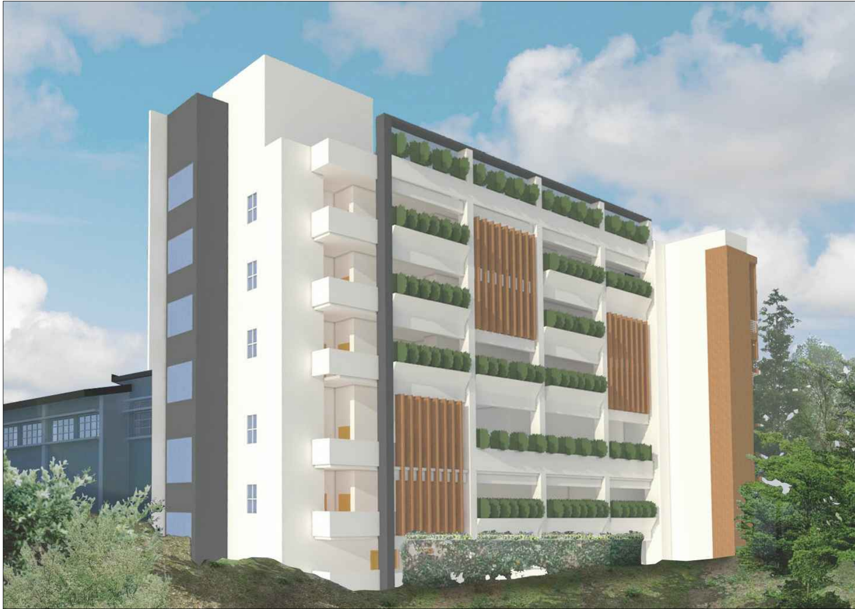
從東北面望向大樓的構思透視圖