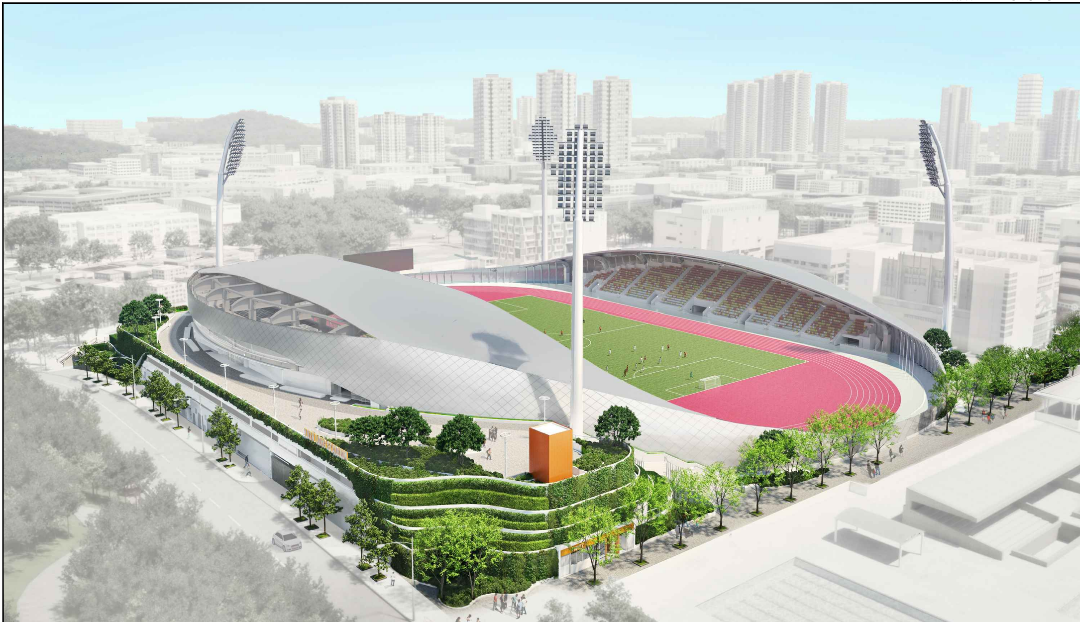
從西南面望向球場的構思透視圖