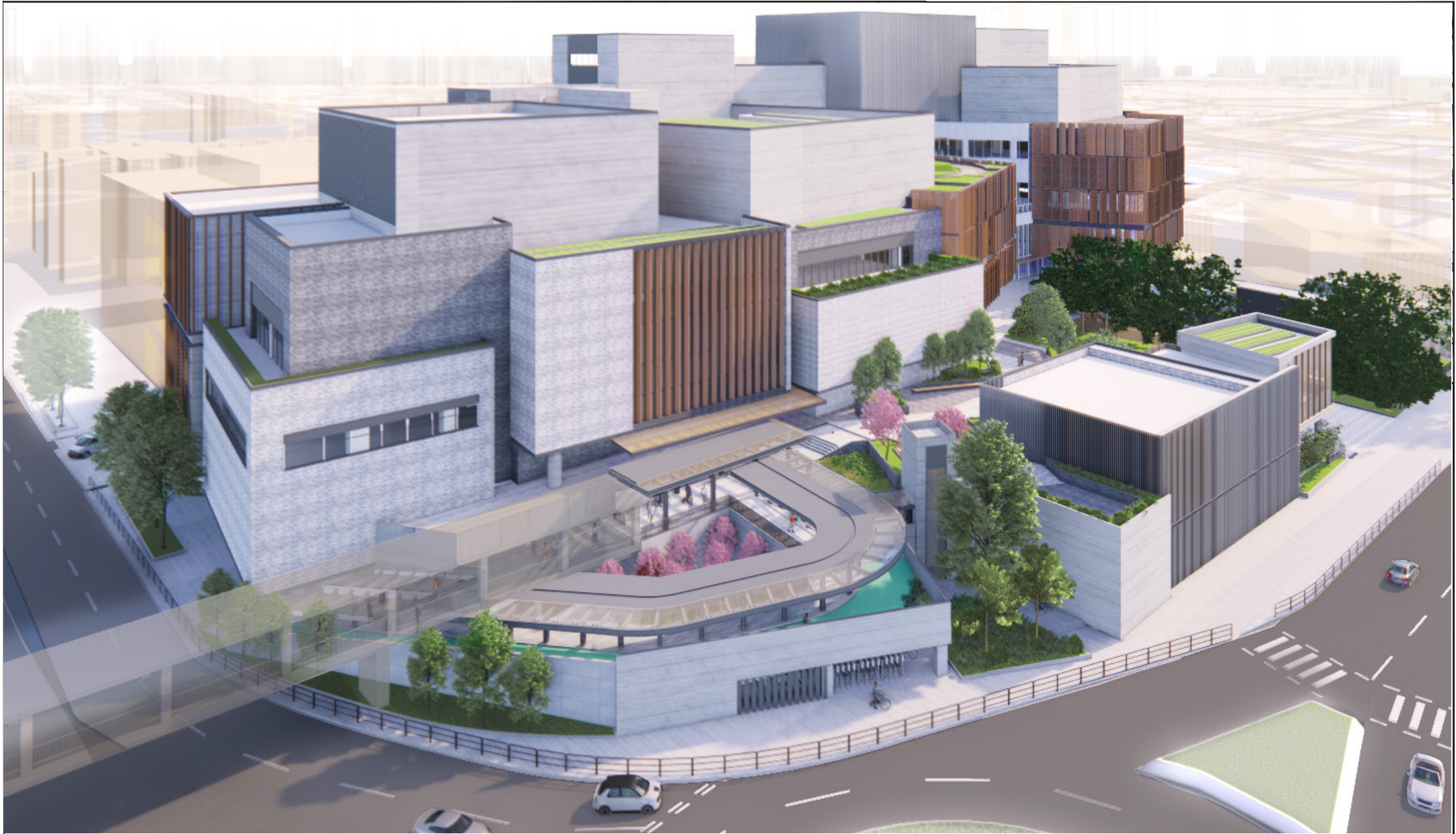
從東南面望向大樓的構思透視圖 PERSPECTIVE VIEW FROM SOUTHEAST DIRECTION