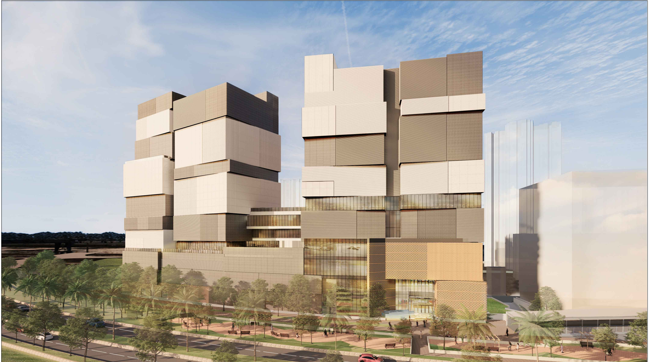
從東北面望向大樓的構思透視圖 PERSPECTIVE VIEW FROM NORTHEAST DIRECTION (ARTIST'S IMPRESSION)