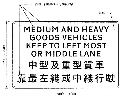
“第 26A 號圖形