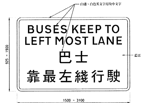
在靠左駛隧道內保持在最左線行駛