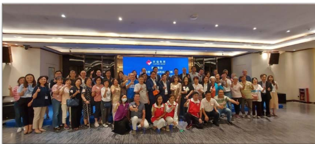
訪問團與祈福新邨的退休港人會面後合照

2.5 在會面期間，議員與居住在祈福新邨的退休港人進行了約一小時的深入交談。議員細心聆聽了他們在內地生活的體驗及需求，包括在醫療和養老方面所面對的問題和期望得到的服務。議員得悉，大部分退休港人在內地生活了一段長時間，對居住環境和生活配套滿意。議員欣悉長者在內地過上幸福生活，但同時也了解到他們在獲取醫療服務和合適的養老設施方面所面臨的挑戰。退休港人滿意內地的居住環境，但期望香港特區政府可以改善有關的醫療配套措施(例如擴大香港醫療券的使用範圍)，以及在廣州地區增設更多適合香港長者居住的養老院舍等。