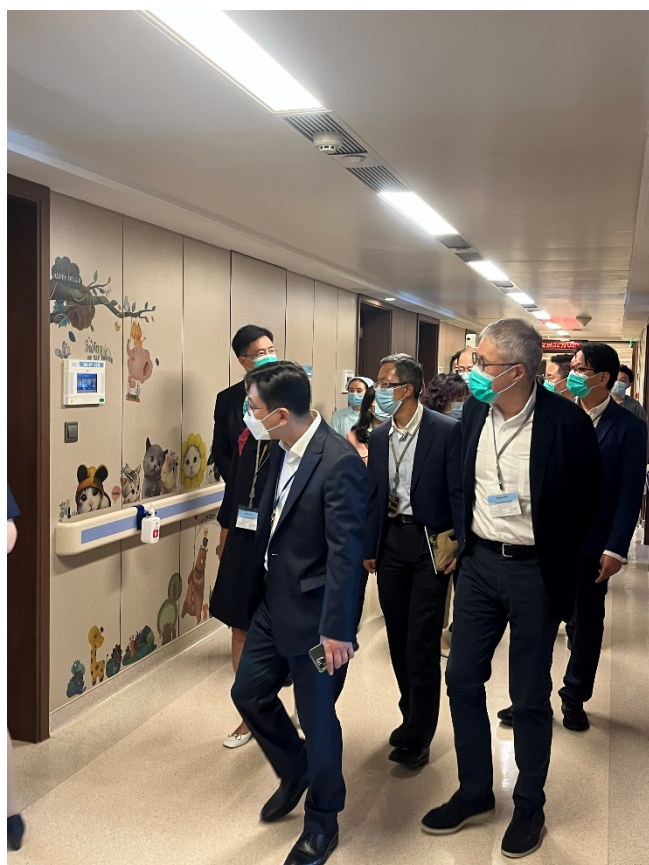
訪問團參觀養老設施