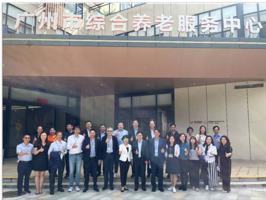
訪問團在海樾薈留影

2.12 訪問團察悉，海樾薈是一項公私營合作的養老項目，旨在透過醫養結合模式打造具有廣州特色、在全國領先、在全省示範、在全市先進的綜合養老服務中心，同時成為養老服務從業人員學習培訓和對外交流的窗口。該中心共有8層，總建築面積超過7 000平方米，提供155張機構養老床位和30張日間照料床位。起始月費為5,500元人民幣。海樾薈為長者提供24小時的醫護服務，且鄰近廣東省第二中醫院白雲院區，與該醫院之間開通了綠色通道。