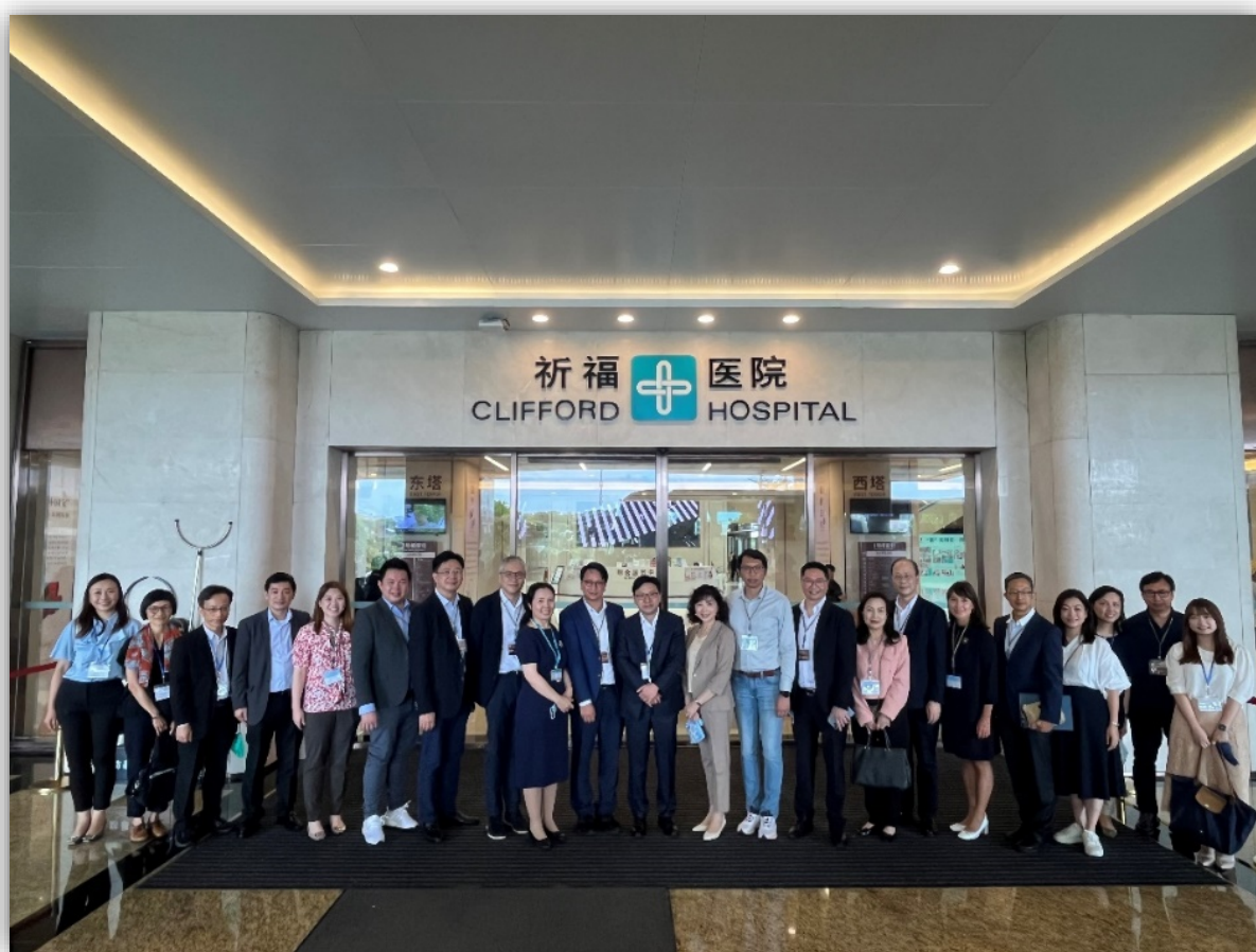
訪問團到訪祈福醫院

2.6 與長者會面結束後，訪問團前往祈福醫院。議員了解到，祈福醫院，是國內首家兼連續7次通過國際JCI 3 認證的大型綜合性三甲中西醫結合醫院，同時也是大灣區“港澳藥械通”指定醫療機構。該醫院的建築面積近30萬平方米，設有大型現代化門診部、住院部、急救中心等設施。