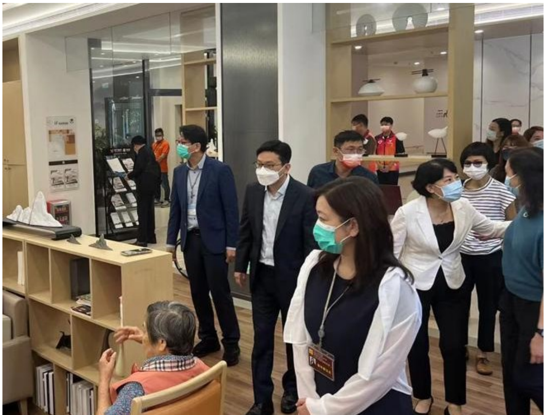
訪問團聽取海樾薈的代表介紹長者的日常活動