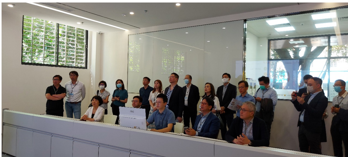
議員參觀海樾薈的“為老服務中心平台”