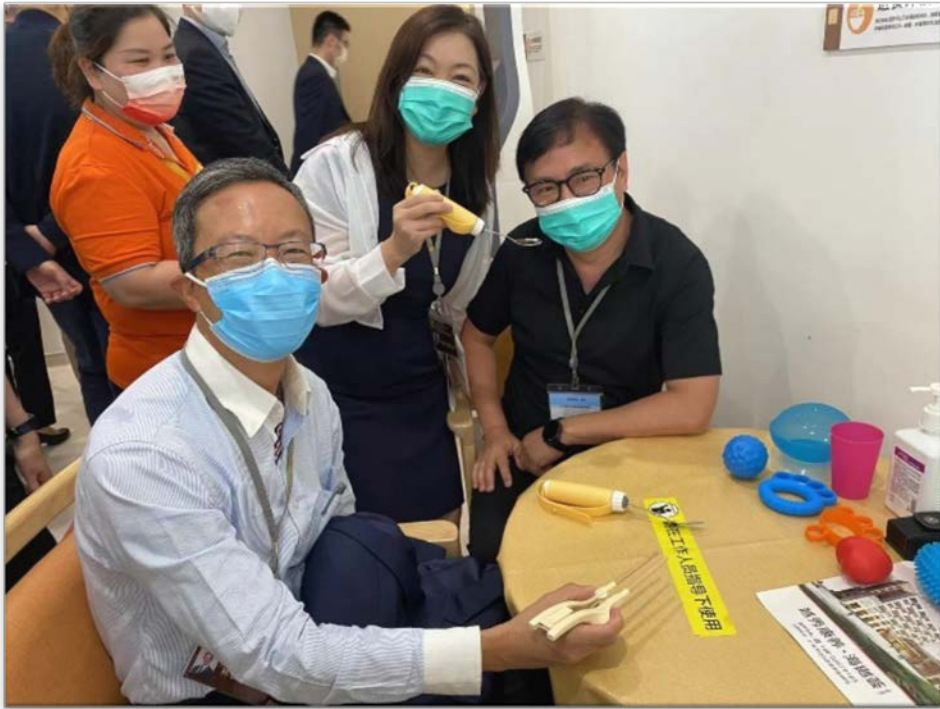
議員親身體驗海樾薈 各種養老設備