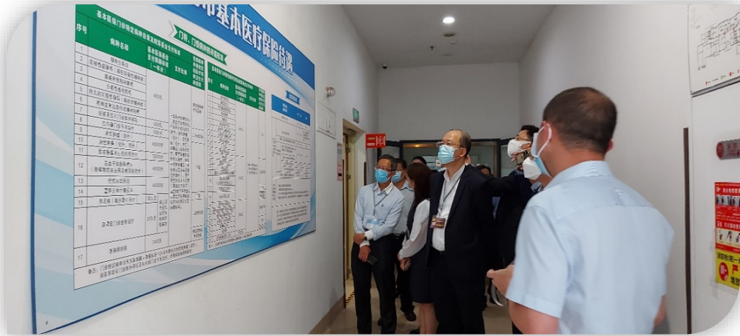
議員聽取善耆家園代表的簡介，了解內地的醫療保險