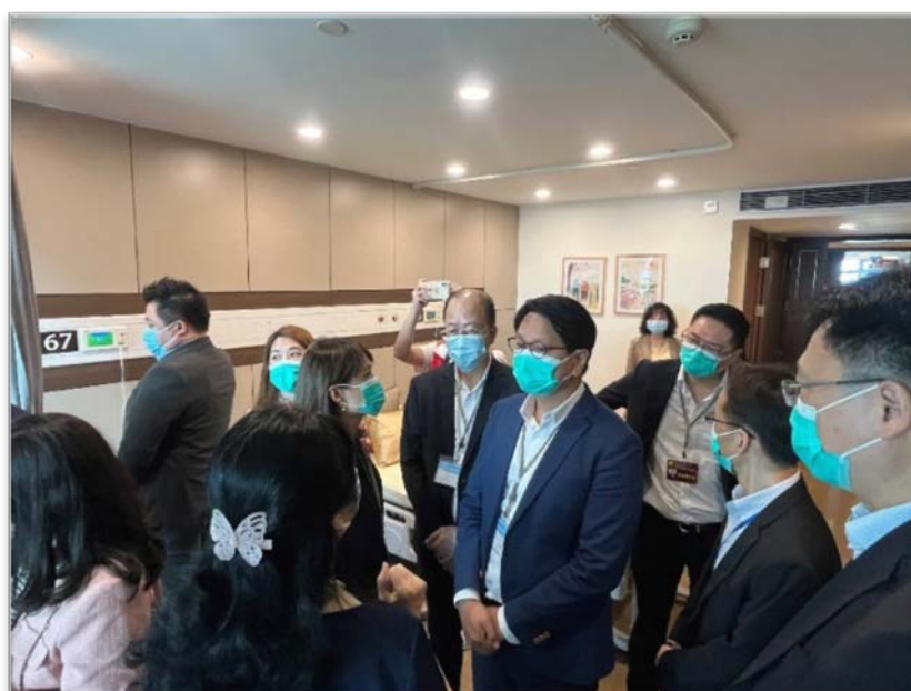
議員參觀祈福護老中心的設施， 了解醫養融合的營運模式

長者提供全方位的照護服務。中心提供醫療救治、康復保健、日常護理、生活照料、營養膳食、精神娛樂、心理服務和特色養生等八大服務體系，讓長者能夠健康養老，享受晚年。議員參觀了中心內的設施，並聆聽了兩位香港退休長者分享在此的生活情況。