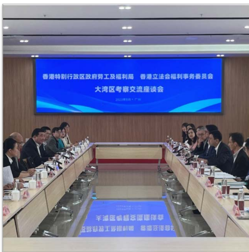
訪問團與廣東省民政廳進行深入交流