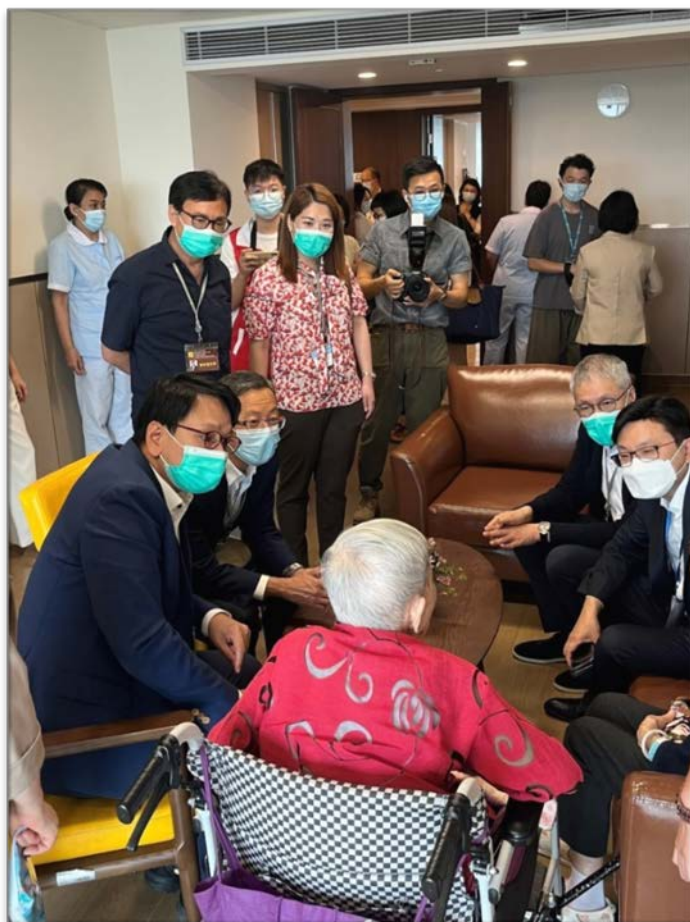
居於護老中心的香港退休長者與議員分享在內地的生活