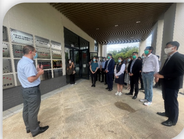
議員參觀善耆家園內的 配套和設施