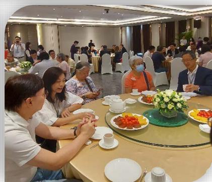
議員與祈福新邨的退休港人傾談，了解他們的生活情況