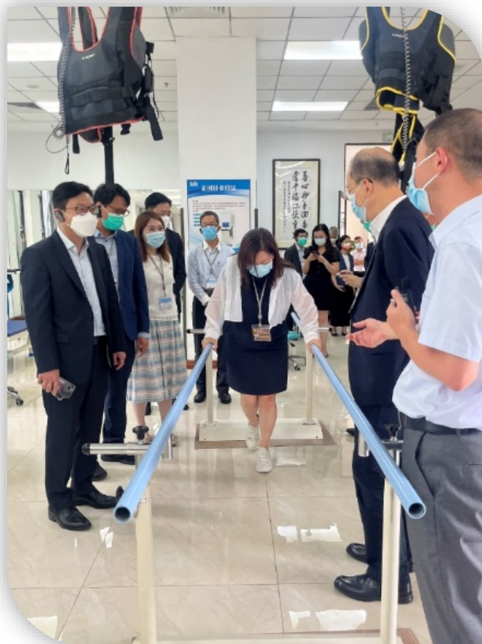
議員親身試用養老設施