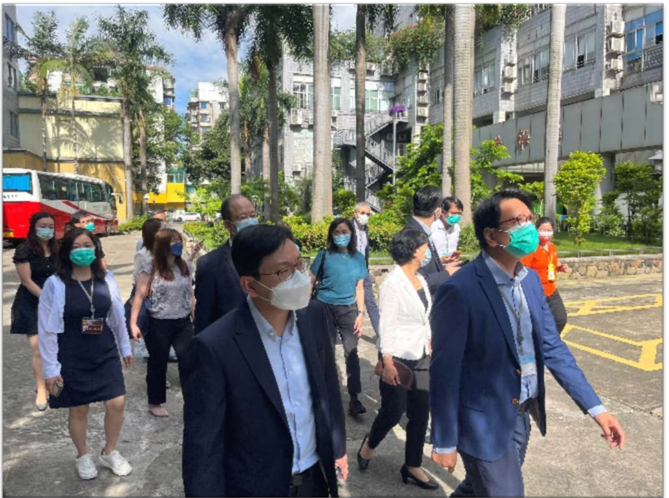
訪問團到訪海樾蒼

2.13 在參觀期間，議員聽取了海樾蒼的代表介紹由專職社工根據長者的興趣愛好及身體情況，設計各種社交文娛活動。議員得悉，越秀康養志願者團隊亦會定期為長者舉辦各類活動，豐富長者生活。議員亦參觀了其“為老服務中心平台”，了解到該電子平台集中設置社區內各類為老服務設施，並依託資訊化管理平台，統籌為老服務資源，提供多樣化服務，方便使用者掌握有關服務的 最新資訊 。