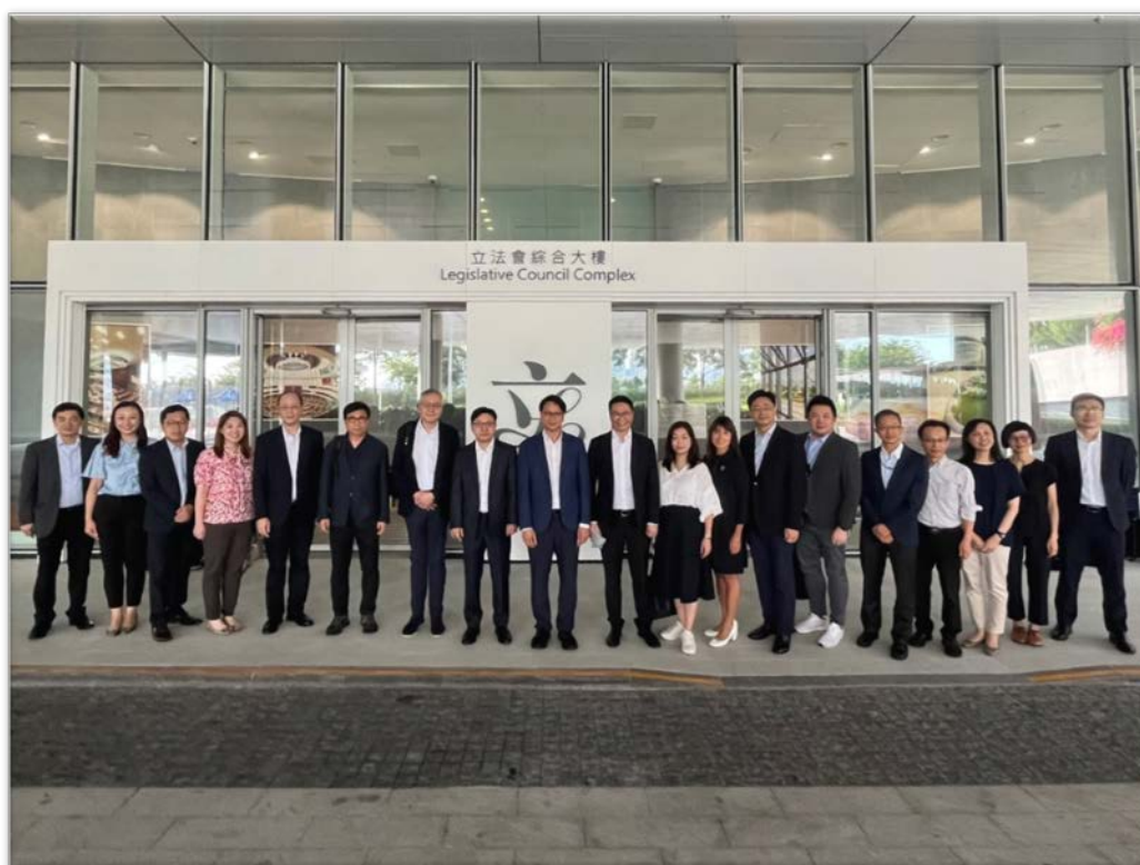
立法會福利事務委員會訪問團聯同勞工及福利局訪問團 由立法會大樓出發，展開職務訪問的行程

1.8 訪問團在行程中曾到訪廣州和佛山兩個大灣區城市。除了與廣東省民政廳、廣東省相關省委員會人員、各市領導以及祈福新邨的退休港人進行了會面和交流，訪問團亦參觀了祈福護老中心、廣州市頤璟健康養老服務有限公司的項目 - 海樾薈，以及佛山市順德區善耆家園養老社區，以深入了解大灣區內地城市的養老服務和港人在內地養老的需求。詳細訪問行程載於 附錄2 。