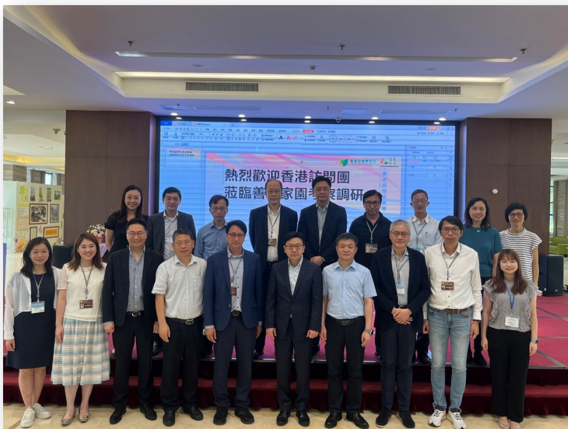
訪問團到訪善耆家園養老社區

3.4 善耆社區是一個定位為“政府主導、社會捐建、市場化運作、盈利循環發展”的非牟利公益慈善養老民辦專案。該專案由廣東省德耆慈善基金會籌集募捐，第一期投資超過2.5億元人民幣。社區的規劃建築面積為11萬平方米，計劃提供1 500張床位，第一期項目已經投入運營，提供870張床位。