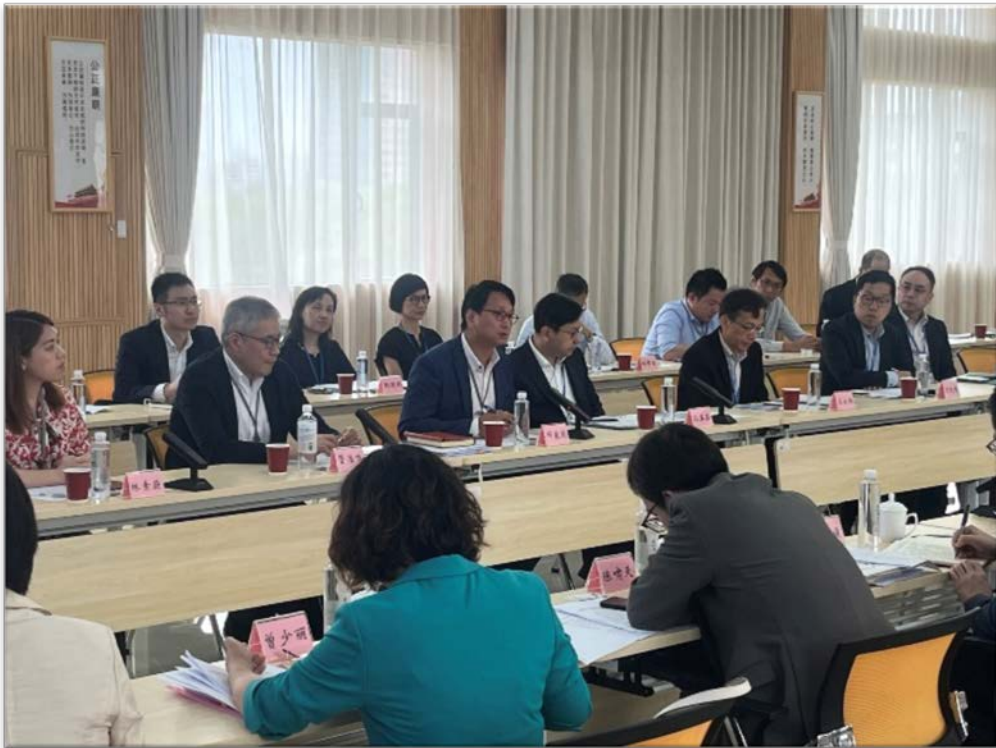
訪問團聽取廣東省民政廳講解養老政策