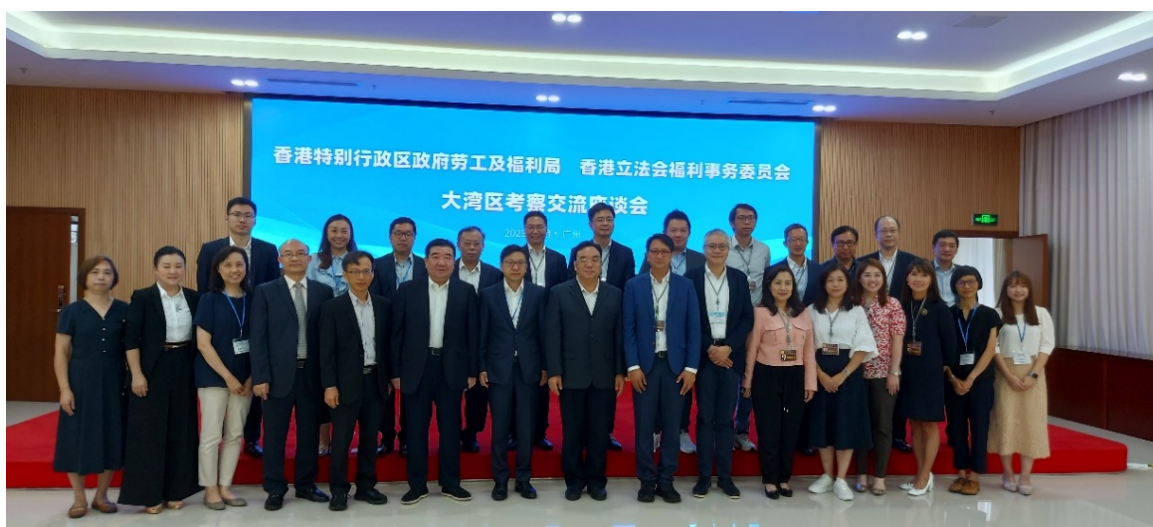
訪問團在與廣東省民政廳會面後留影