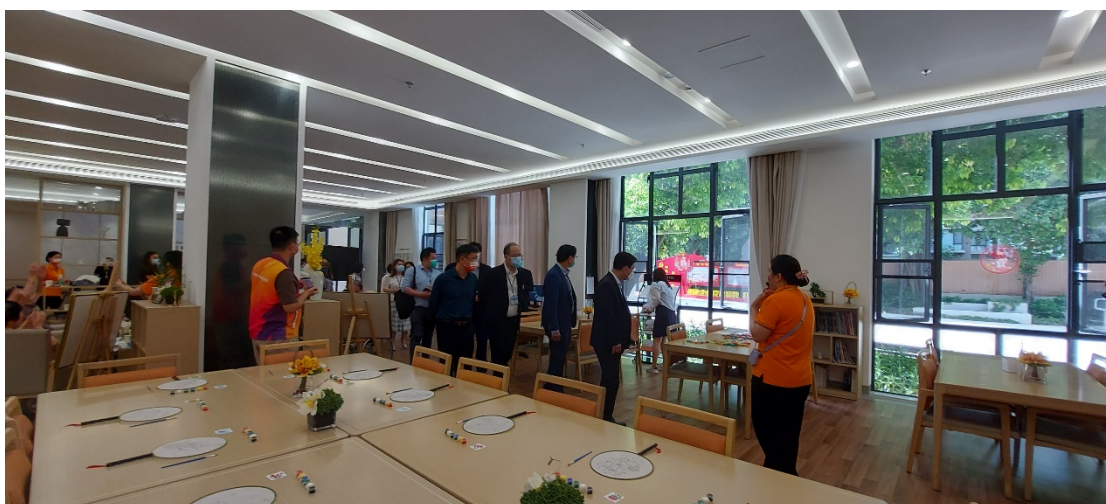
議員參觀各種為長者設計的社交文娛活動設施