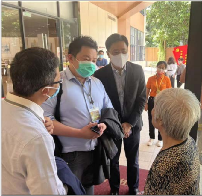
議員與居於海樾薈的長者傾談，了解他們的生活情況