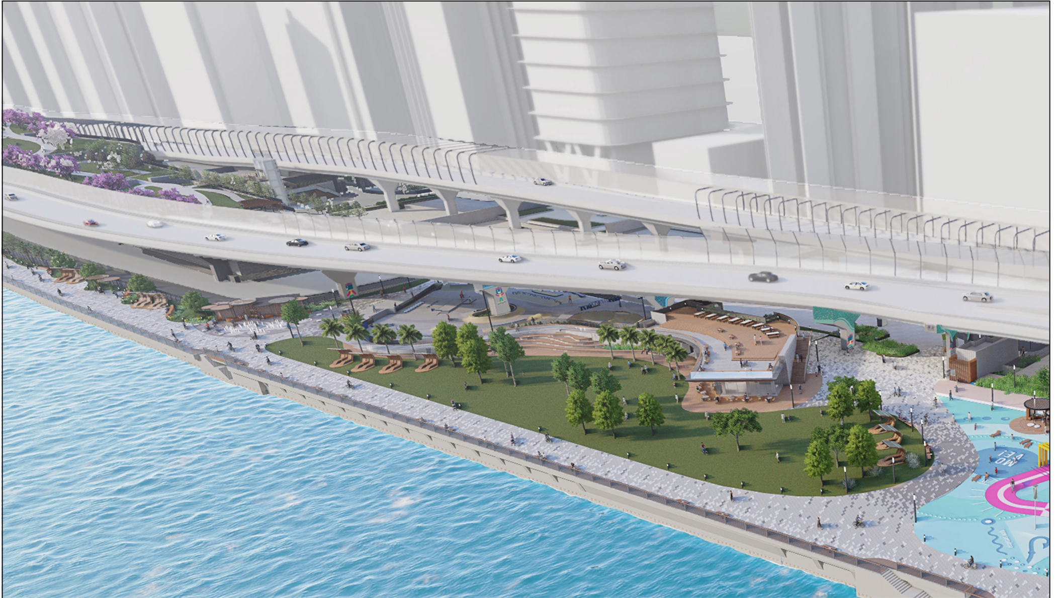
從西北面望向休憩用地的構思透視圖 PERSPECTIVE VIEW OF OPEN SPACE FROM NORTHWEST DIRECTION