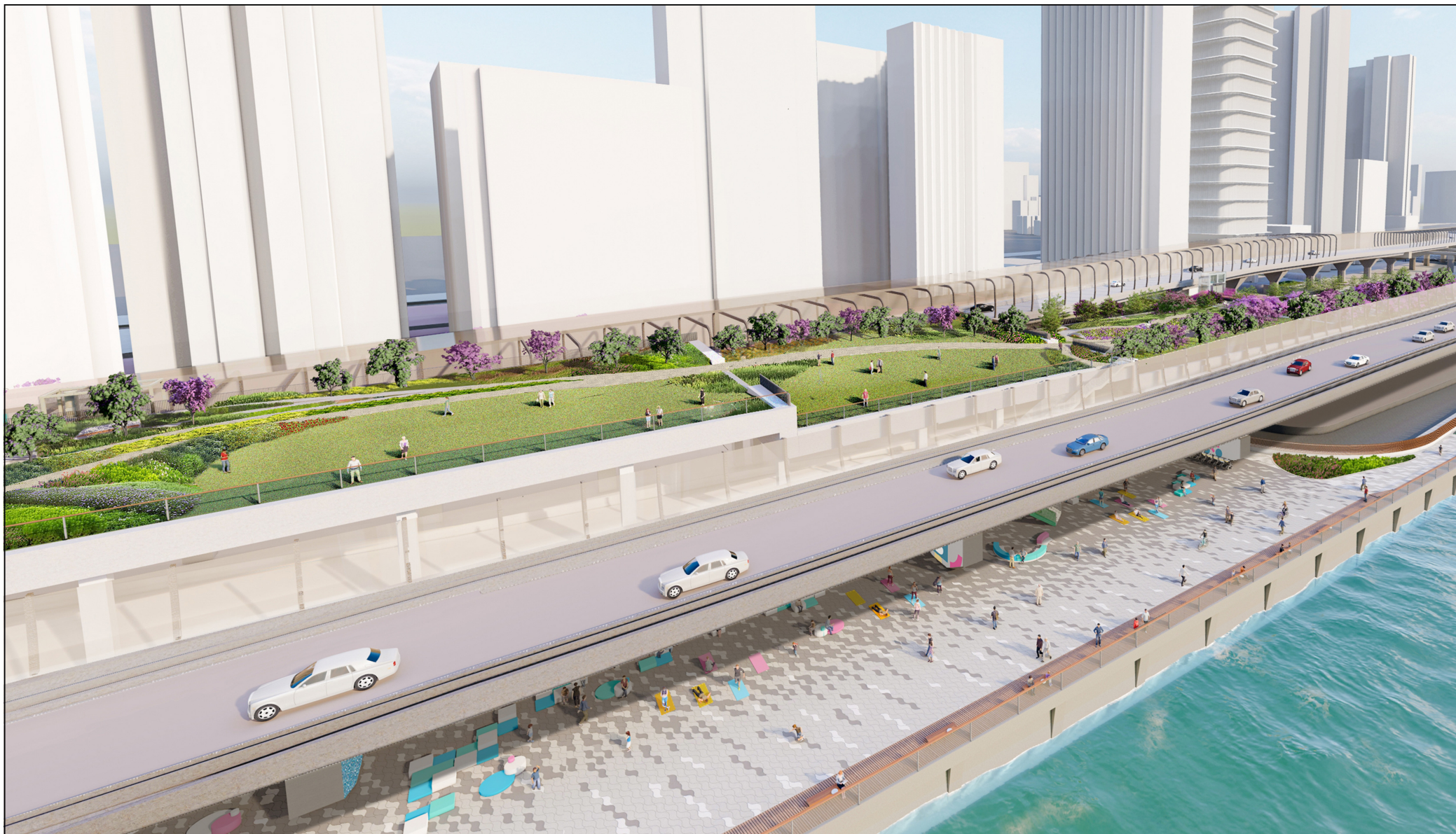
從北面望向休憩用地的構思透視圖 PERSPECTIVE VIEW OF OPEN SPACE FROM NORTH DIRECTION