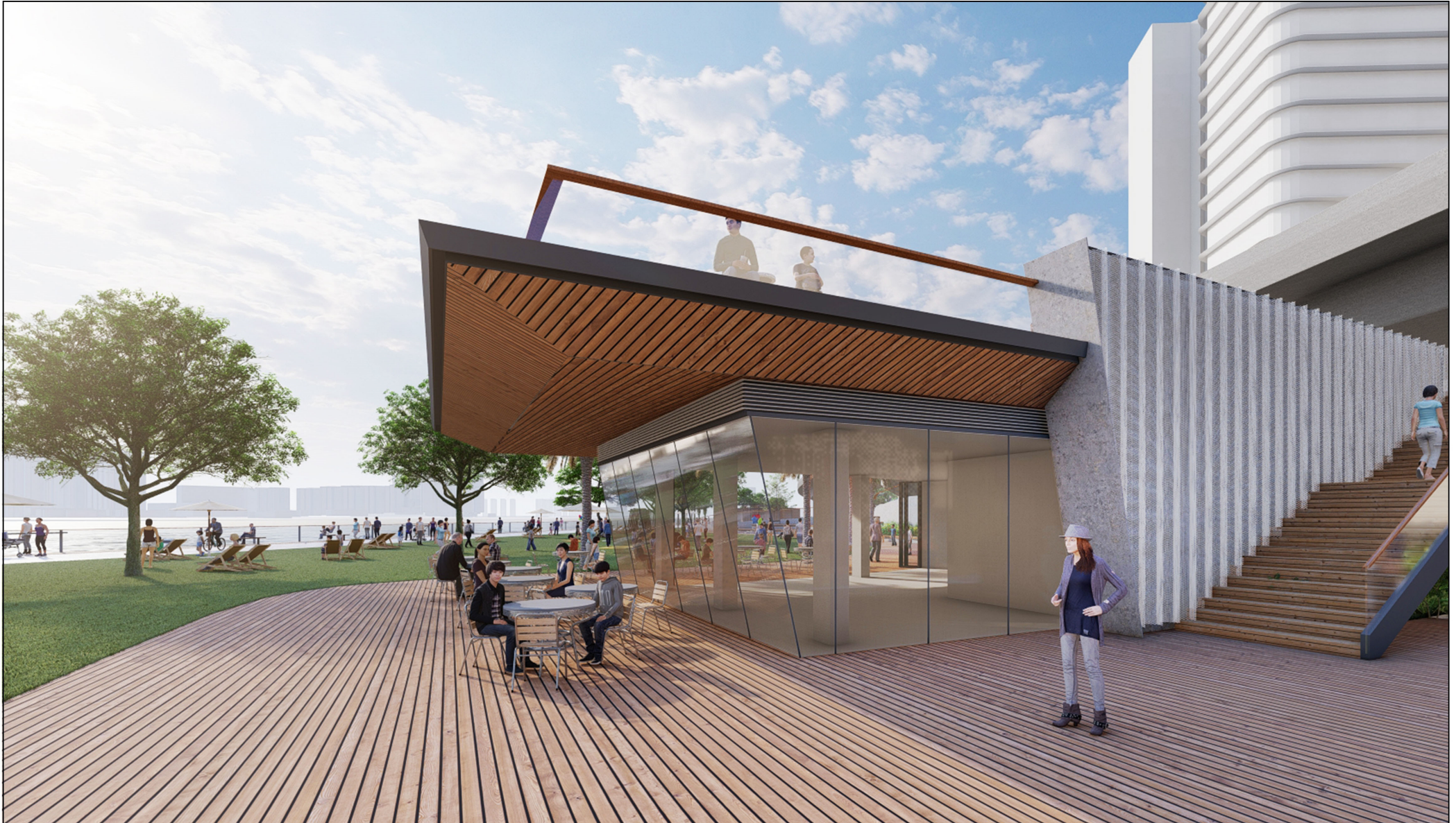
從南面望向餐廳的構思透視圖 PERSPECTIVE VIEW OF RESTAURANT FROM SOUTH DIRECTION