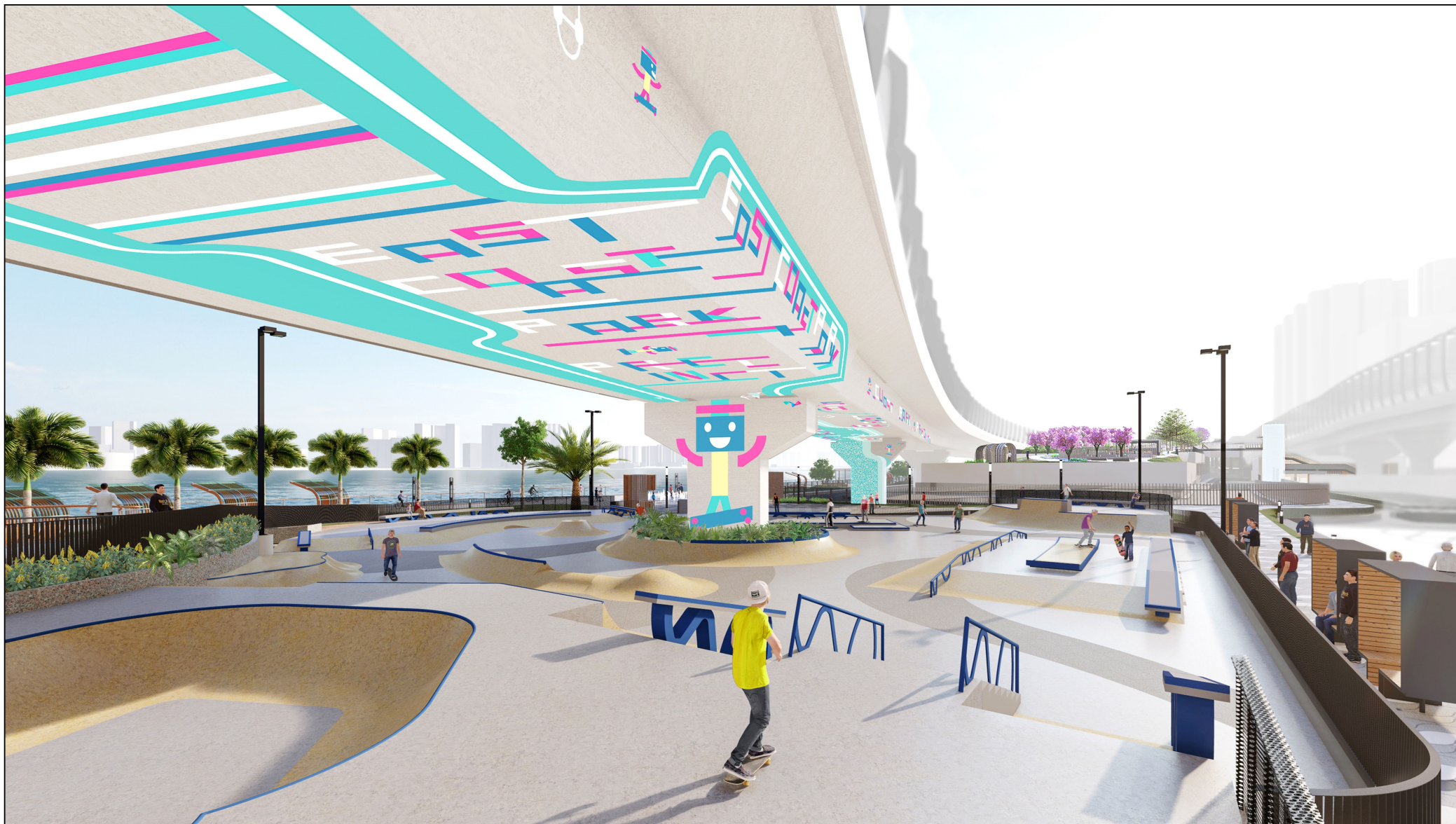
從西南面望向極限運動場的構思透視圖 PERSPECTIVE VIEW OF EXTREME PARK FROM SOUTHWEST DIRECTION