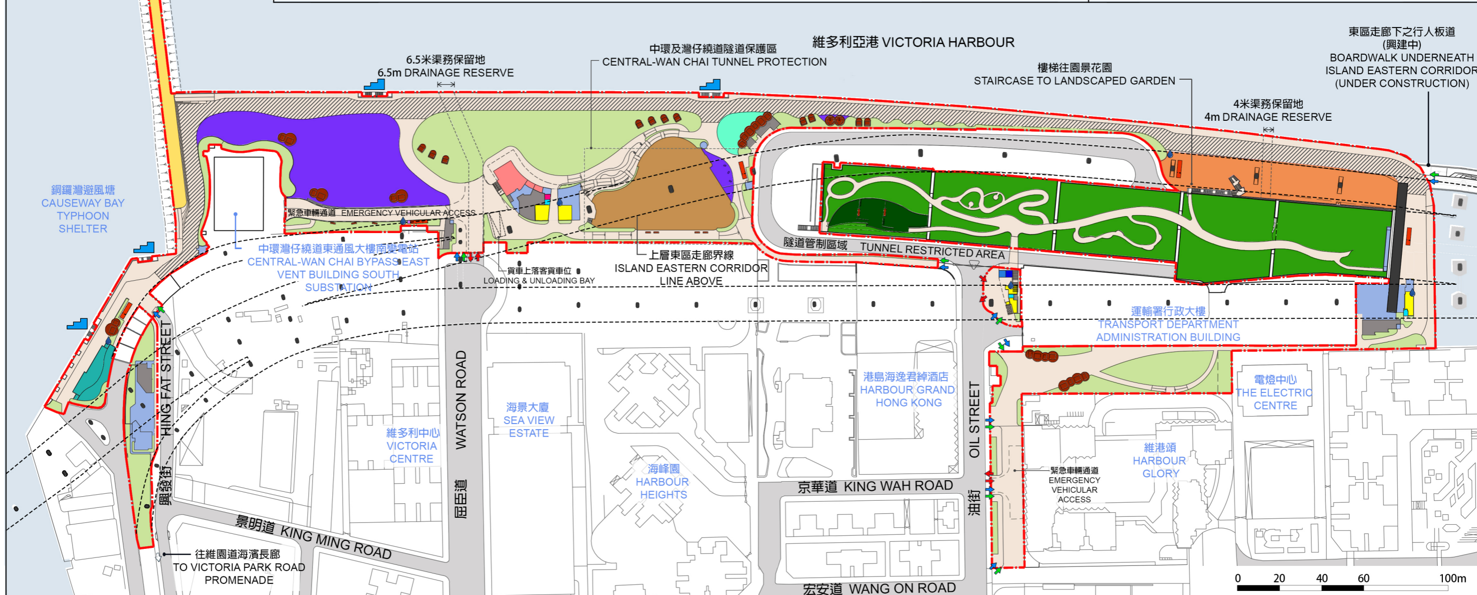
工地平面圖 SITE PLAN

477RO 北角東岸公園主題區公眾休憩用地 PUBLIC OPEN SPACE AT EAST COAST PARK PRECINCT, NORTH POINT