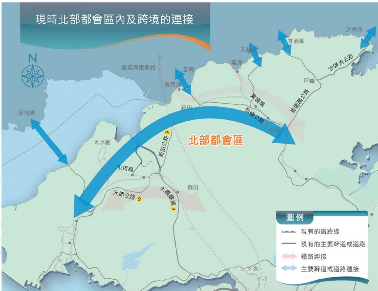
現時網絡 Existing Network