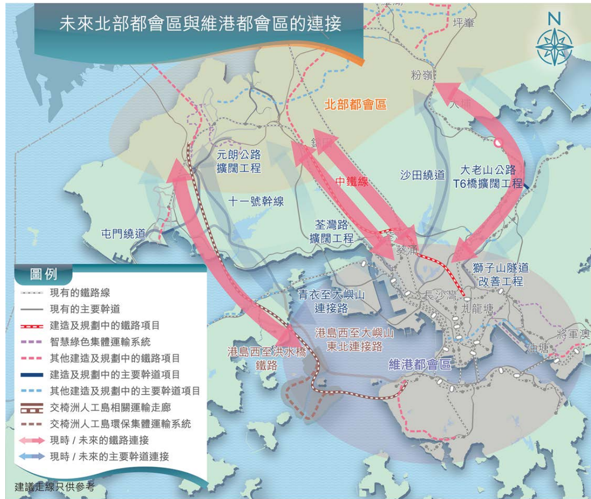
未來網絡 Future Network