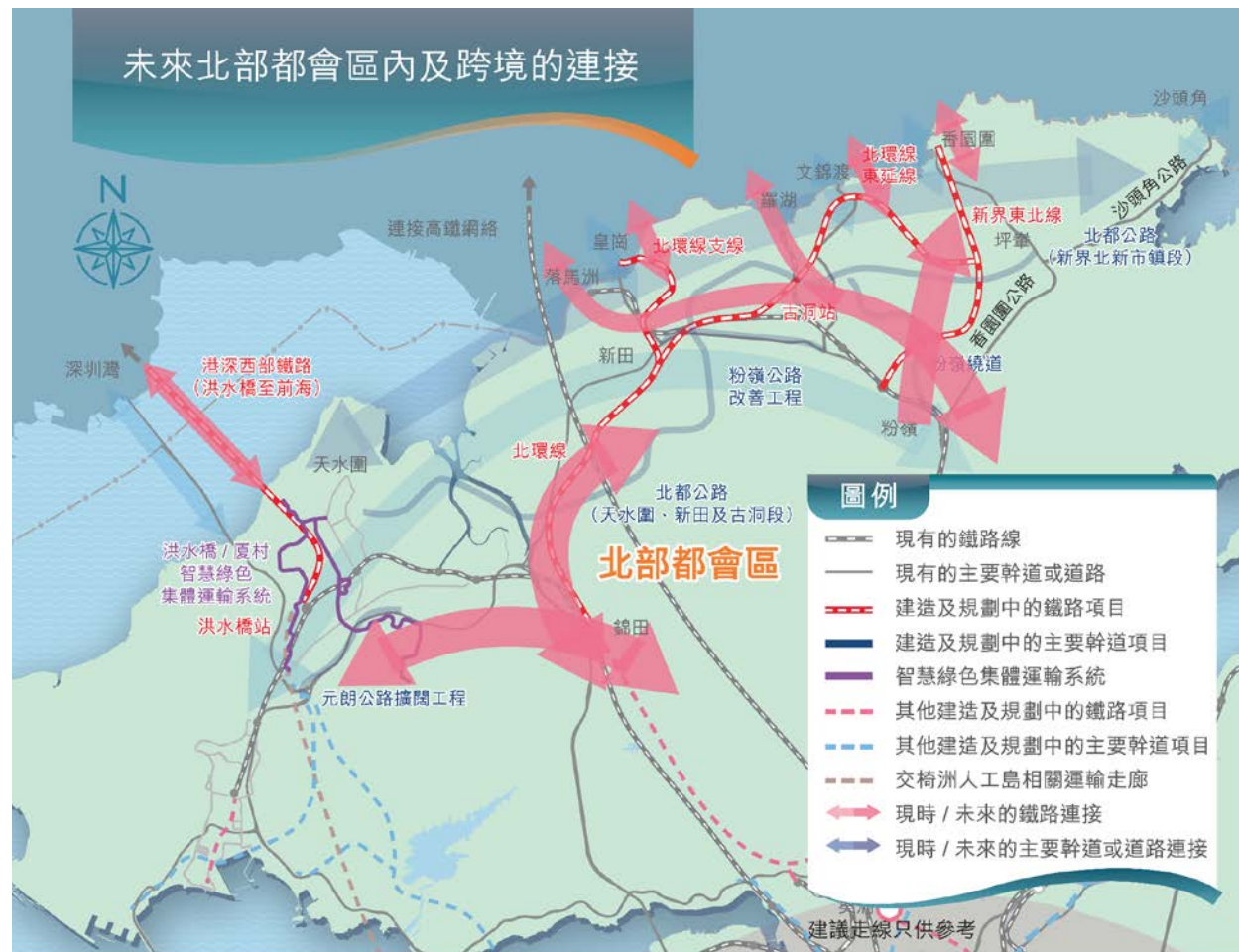
未來網絡 Future Network