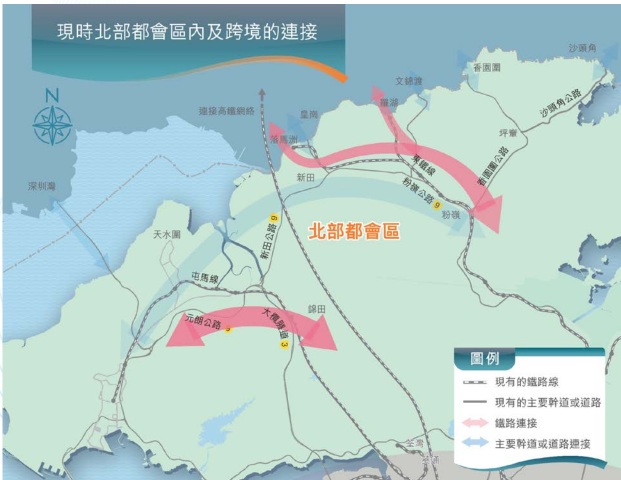
現時網絡 Existing Network