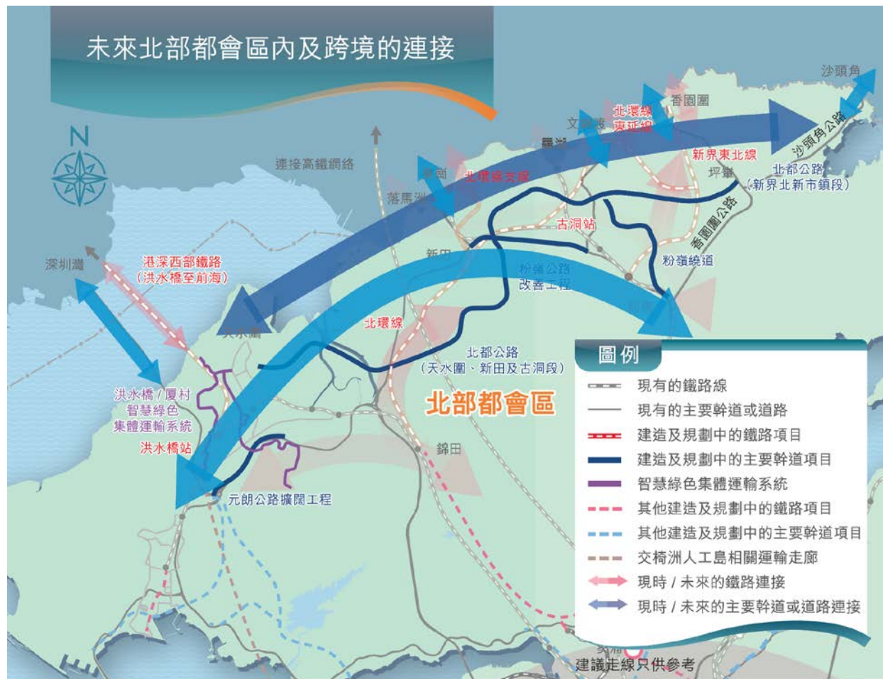
未來網絡 Future Network