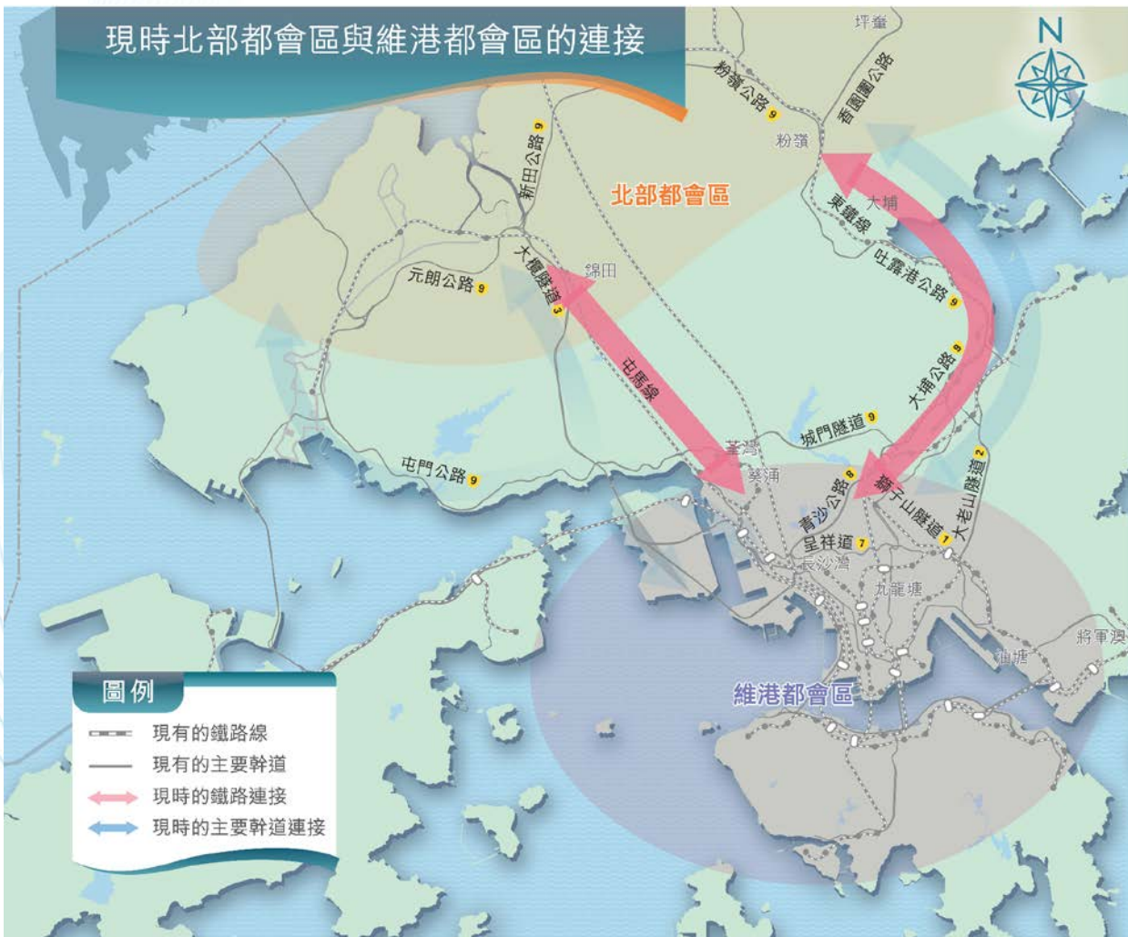
現時網絡 Existing Network