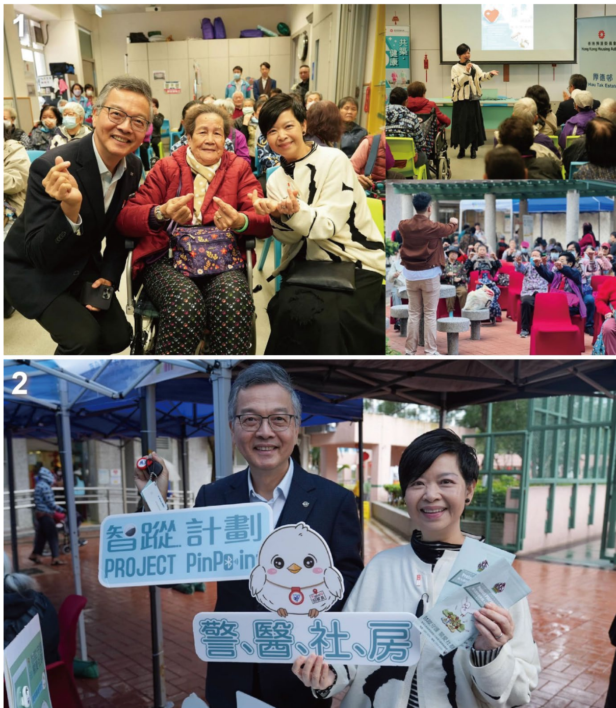
1) 靈實協會健康推廣活動